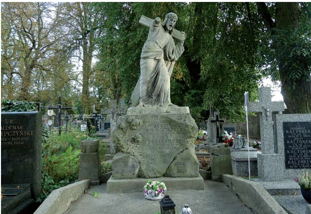
Nagrobek rodziny Rostkowskich na cmentarzu parafialnym przy ul. Płońskiej, 2024 r.