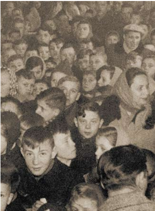
Sala widowiskowa ledwo pomieściła dzieci i ich rodziców na imprezie noworocznej. Zdjęcie pochodzi z lat 60