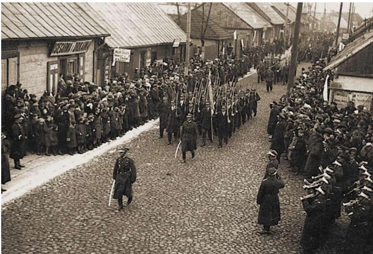
Orkiestra 11 p.uł. podczas jednej z uroczystości w mieście, lata 30. XX w.

z dostateczną ilością rzemieślników cywilnych.” Pułk zatrudniał kobiety w kuchni parowej i przy obieraniu ziemniaków. Kobiety zatrudnione jako obieraczki, czasami zaczynały pracę już o północy. Zimą dodatkowo myły menażki po obiedzie i kolacji.