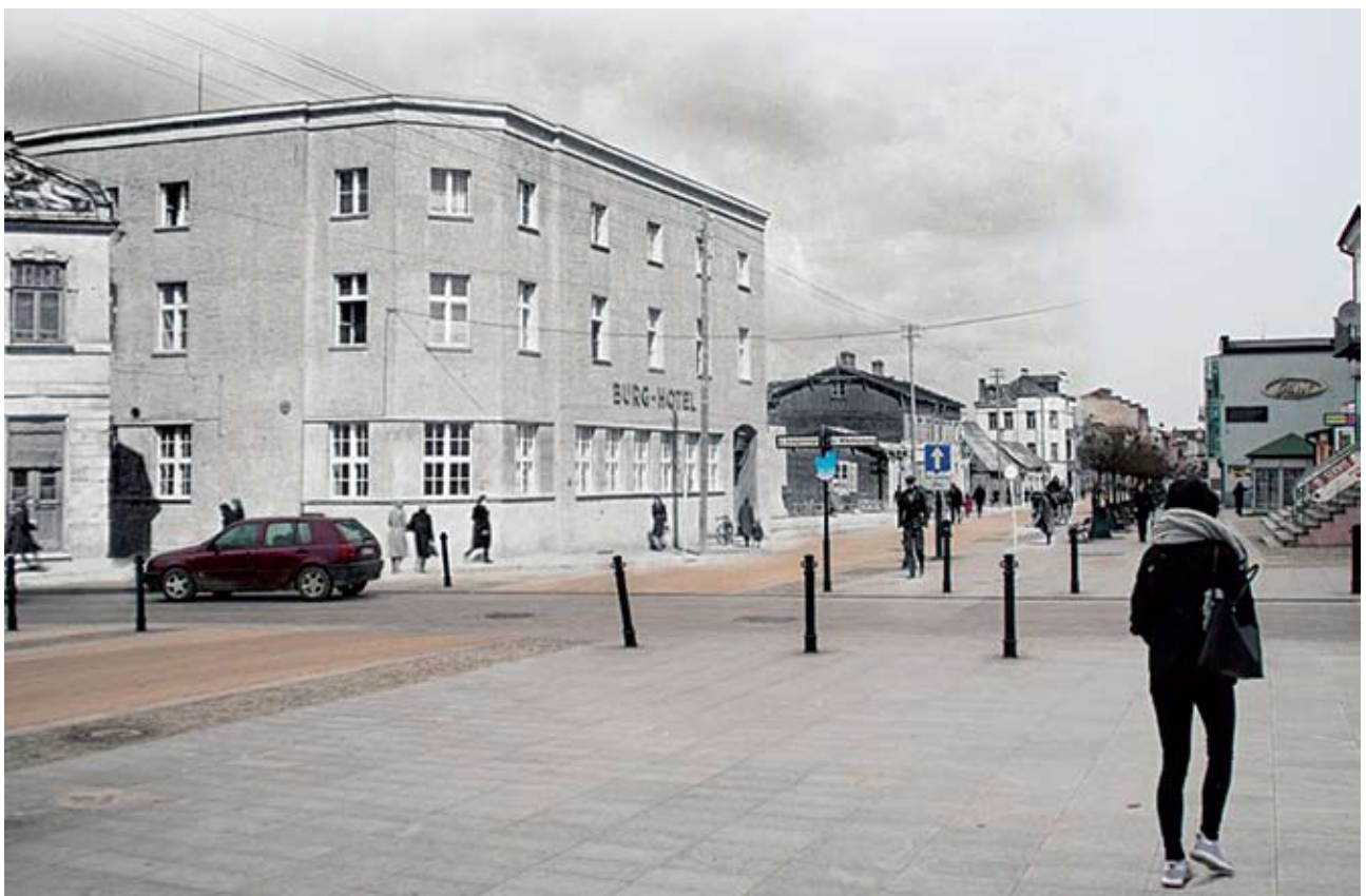
Widok ulicy Warszawskiej w stronę Ryнку. Stare zdjęcie wykonano w 1941 r. po przebudowie hotelu Polonia i zburzeniu drewnianej zabudowy po nieparzystej stronie ulicy