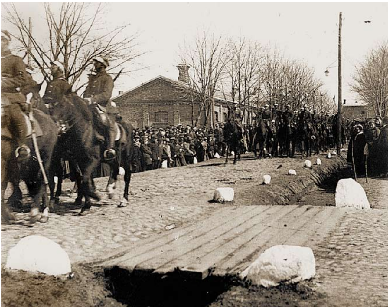
Defilada 11 p.uł. w Ciechanowie z okazji przybycia Marszałka Edwarda Rydza-Śmigłego, 18.05.1939 r.