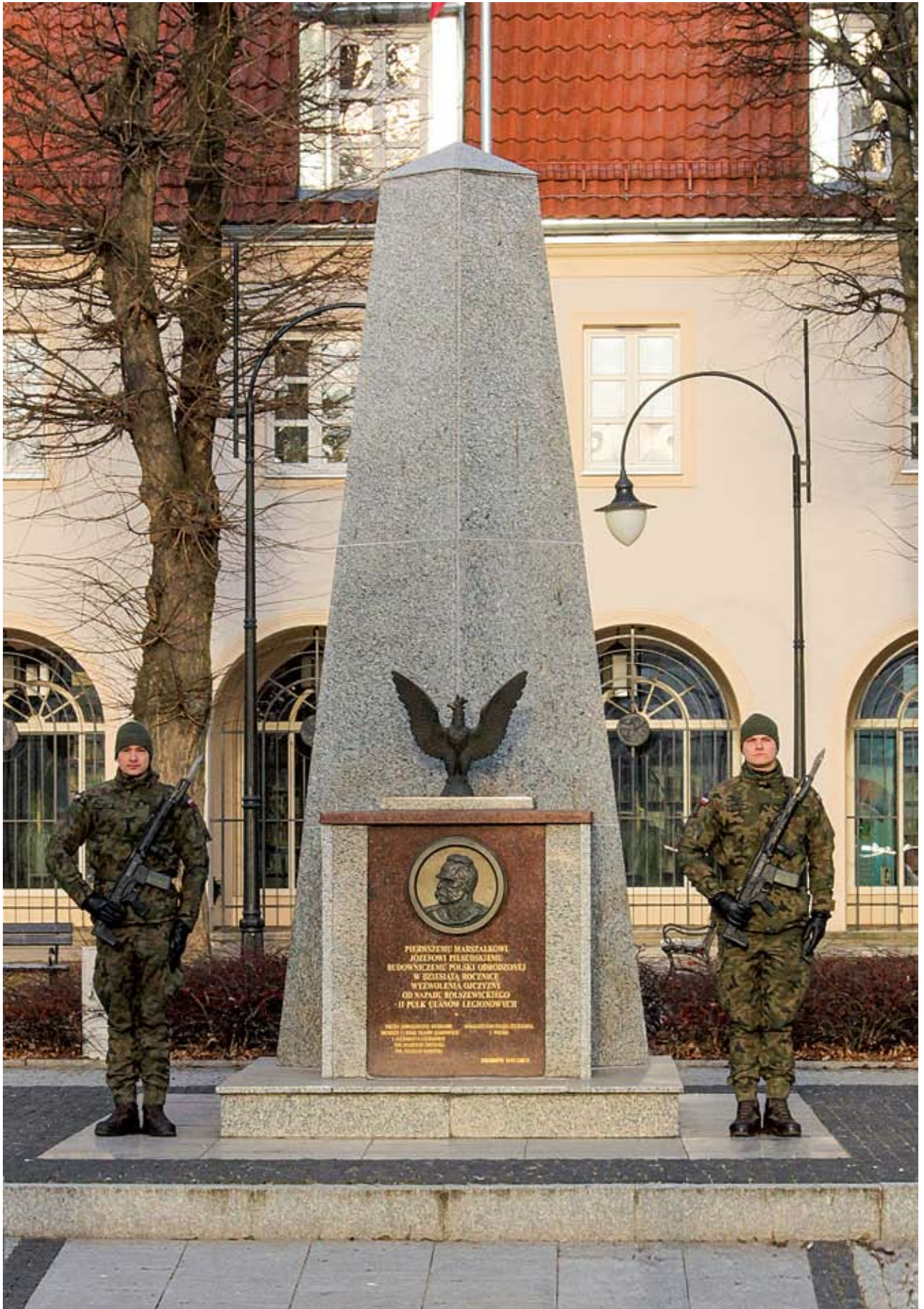
Pomnik na pl. Piłsudskiego