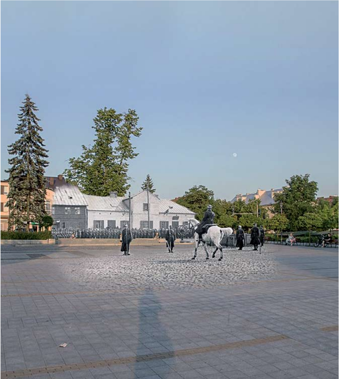
Ułani na ciechanowskim Rynku na tle domu pod nr 16 zbudowanego jako karczma, prawdopodobnie około 1885 roku. W czasie okupacji niemieckiej część budynku rozebrano, a po wojnie poprowadzono tędy górną jezdnię ul. Pultuskiej (stara fotografia z lat 30-tych XX wieku pochodzi ze zbiorów Wiesława Brodeckiego)