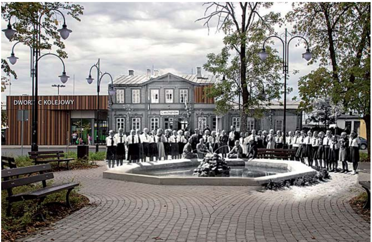
Otwarcie nowej fontanny przed dworcem kolejowym - 1 maja 1950 r. W tle elewacja dworca, który to budynek całkiem niedawno zburzono, zamiast przywrócić mu dawny wygląd i dostosować wnętrza do nowych potrzeb