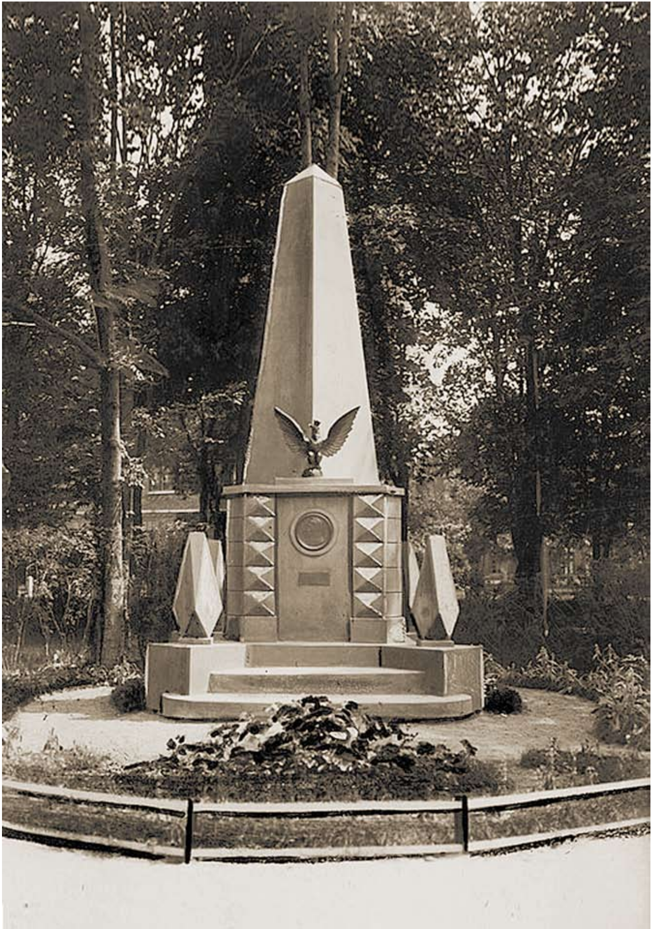
Pomnik Kronika Ciechanowska