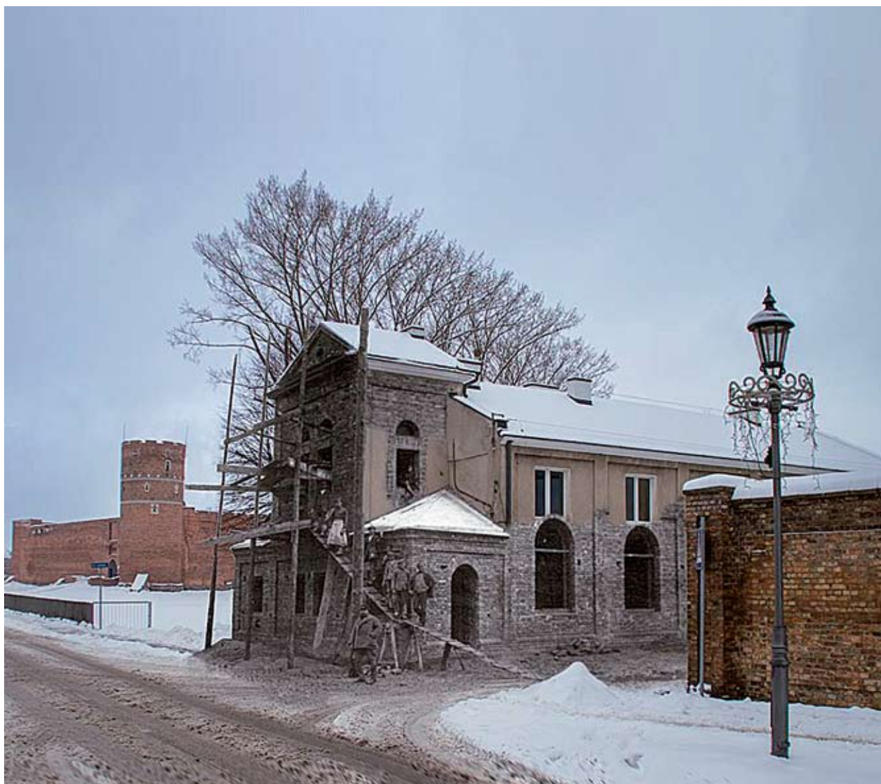
Budowa elektrowni przy ul. Nadrzecznej. Stare zdjęcie pochodzi z 1924 r.