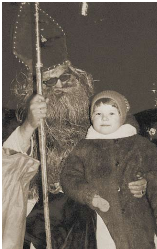
Dzieci mogły sobie zrobić pamiątkowe zdjęcie z Mikołajem