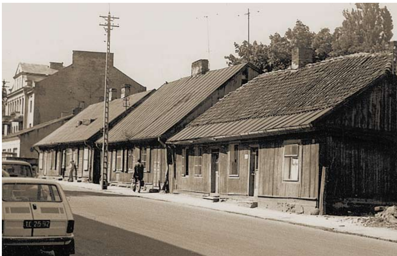
Ul. Warszawska 48-52, 1978 r.

Nowa działka Rostkowskich składała się z placu rozciągającego się od ulicy Warszawskiej do Kościelnej i budowli na takowym: domu drewnianego frontowego od ul. Warszawskiej, dwóch oficyn, chlewów i innych zabudowań oraz sadka owocowego . Hudes Lis zastrzegła tylko sobie możliwość zajmowania dotychczasowego swego mieszkania do 1 V 1921 r. Nabywcy zapłacili wspólnie 100 tysięcy marek polskich i każdy z nich został właścicielem 1/3 niepodzielnej części nieruchomości. W domu zamieszkały prawdopodobnie, oprócz lokatorów, tylko siostry