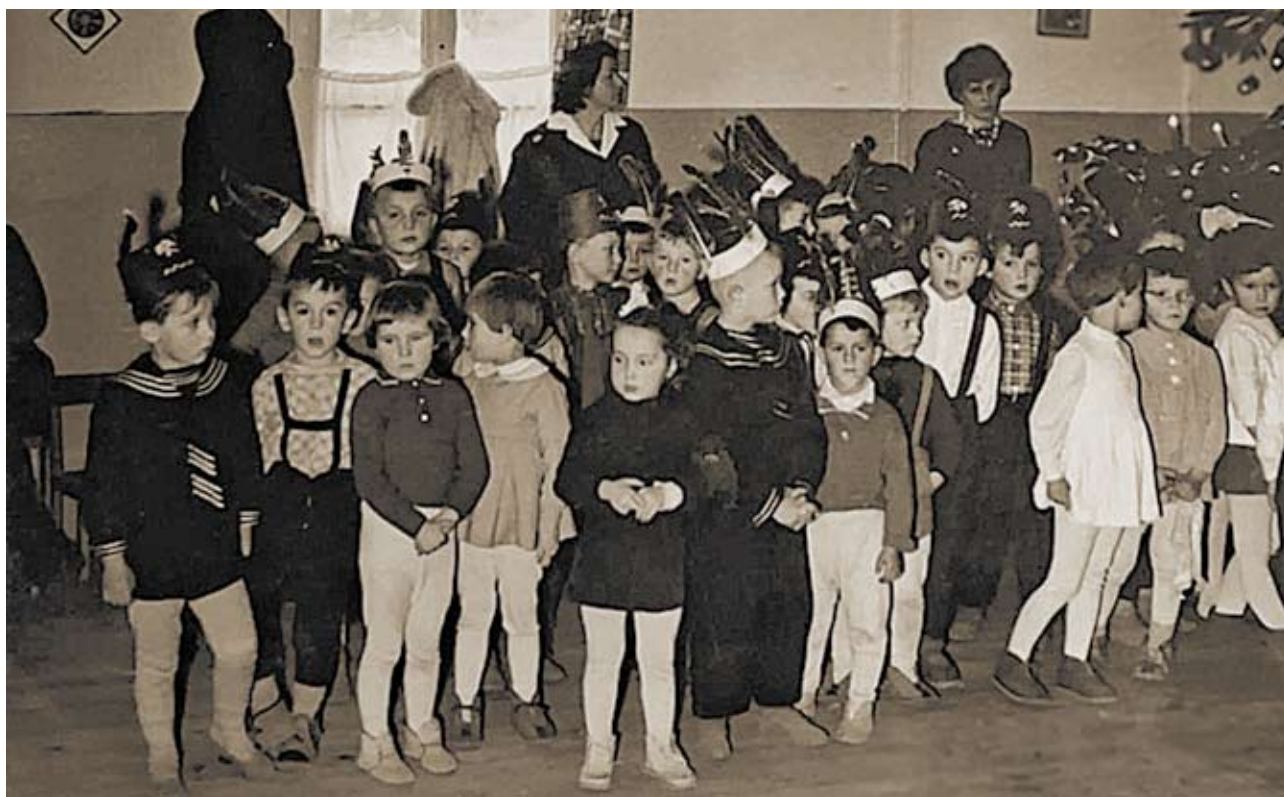
Dzieci czekają na wizytę św. Mikołaja. Przedszkole przy ul. Augustiańskiej, 1963 r.