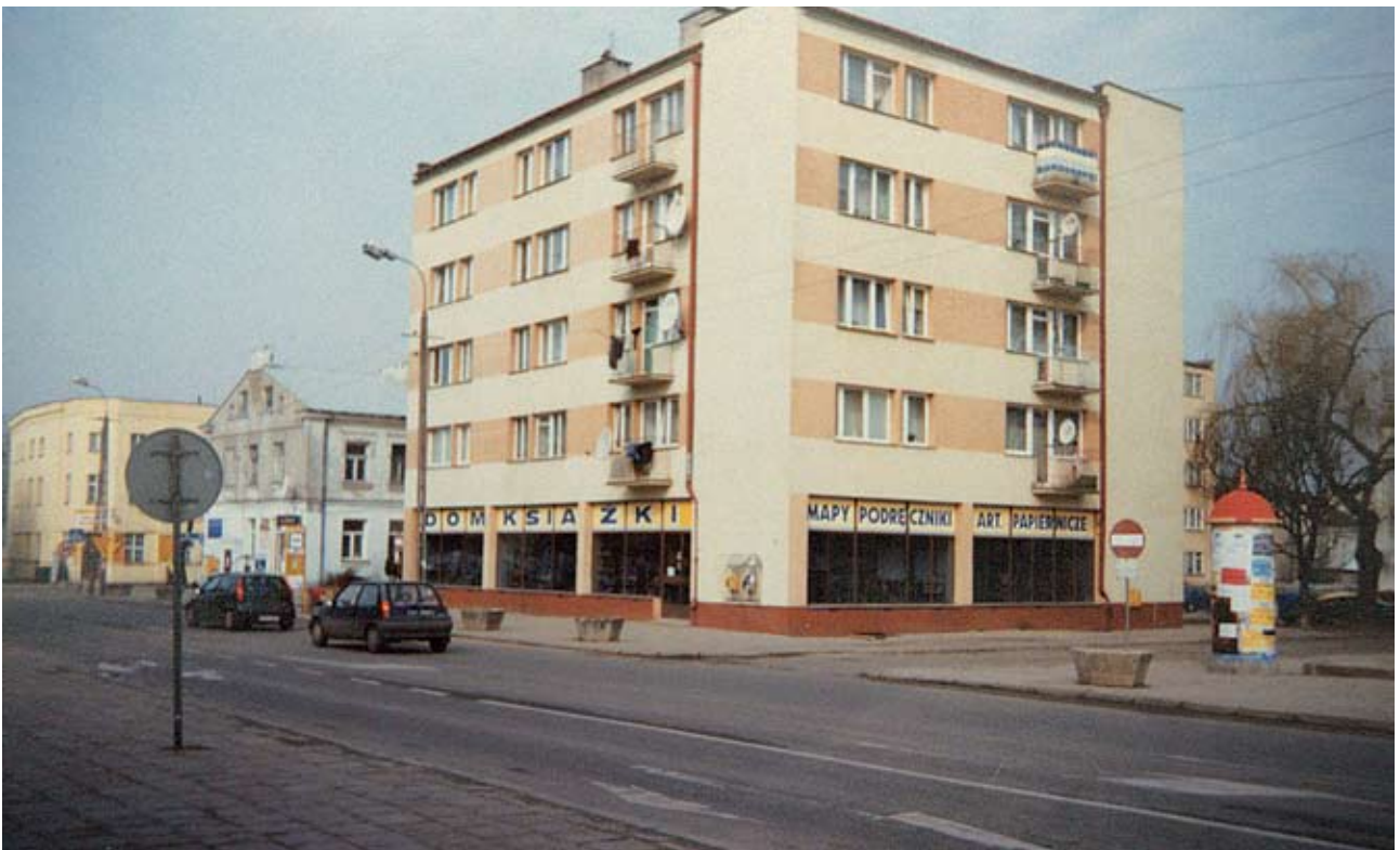
W latach 1971–1972 otwarto nową księgarnię przy ul. Mikołajczyka, dawnej Duracza (obecnie mieści się tu sklep Rossmann)