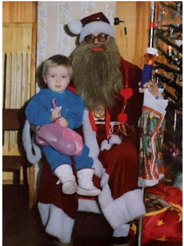
Choinka organizowana przez PSS Społem, 1995 r. Przygotowano 130 paczek dla dzieci w wieku 2-8 lat