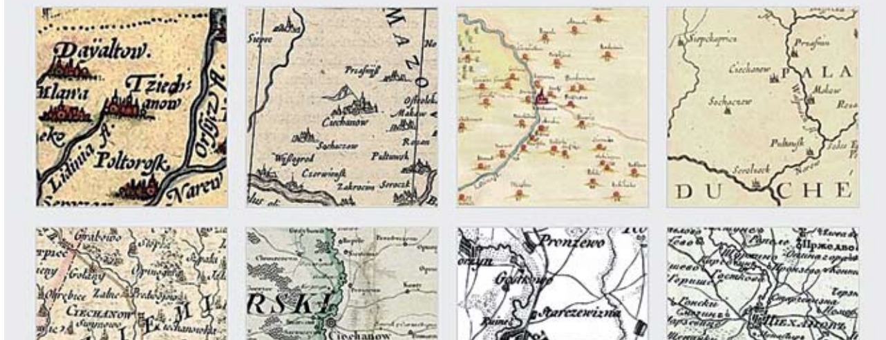
Widok aktualnej witryny – dział „Mapy i Plany”

Równoległe, wraz z rozwojem tzw. mediów społecznościowych, od 2011 roku zainicjowaliśmy profil naszej witryny na portalu „Facebook” ( facebook.com/ciechanow ). Aktualnie ma on 9 tys. obserwujących i co pewien czas także tam zamieszczane są posty ze starymi zdjęciami, obrazami lub ogólnymi tematami związanymi z architekturą i przestrzenią, które mają za zadanie pobudzać do refleksji i dyskusji.