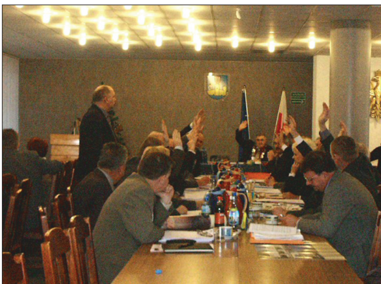
Za budżetem głosowało 16 radnych

Ambitny, spójny, elastyczny, odważny, odmienny od budżetów wielu poprzednich lat — tak pozytywne opinie o budżecie 2005 roku padały z ust radnych podczas XXV sesji Rady Miasta Ciechanów. Potwierdziło je głosowanie. 16 radców opowiedziało się za budżetem, proponowanym przez prezydenta Waldemara Wardzińskiego, przeciwko zagłosowało 5 radnych SLD. Budżetowe plany wysoko ustawiają poprzeczkę służbom Urzędu Miasta. 17 047 tys. zł na inwestycje to aż 21,8% wszystkich wydatków, przewidzianych na ten rok. Dla porównania: w 2002 r. było to 9,4%, w 2003 — 9,8%, w 2004 — 11,5%. Rosną wydatki, ale i dochody, wśród których znaczące miejsce zajmuje 3 570 tys. zł z pierwszej transzy środków z Europejskiego Funduszu Rozwoju Regionalnego (całość unijnego dofinansowania, które udało się pozyskać miastu to 5 898 tys. zł). Po raz pierwszy od dawna budżet uchwalono w optymalnym terminie, tuż przed początkiem 2005 roku. Oznacza to, że prace nad jego wykonaniem mogły ruszyć zaraz po pierwszym styczniu.