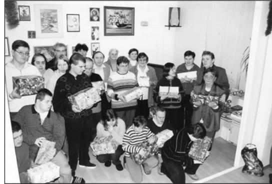
Dary otrzymali m.in. podopieczni Środowiskowego Domu Samopomocy

dziecięce, zabawki oraz paczki z żywnością i słodyczami. Dary zostały przekazane 22 grudnia podopiecznym Środowiskowego Domu Samopomocy.