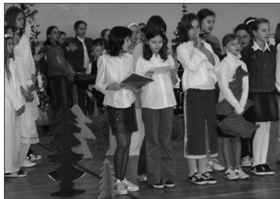
Na szkolny występ dzieci same przygotowały kolorowe kostiumy

Narodzenia w Europie”. W programie znalazły się przedstawienia jasełkowe i kolędy śpiewane po polsku, niemiecku, angielsku i rosyjsku. W ten sposób mali artyści przekazali swym