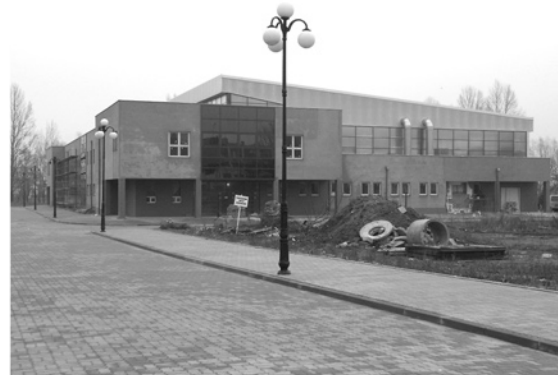
Kłopoty Mostostalu Gdańsk, głównego wykonawcy Hali Sportowej przy ulicy 17. Stycznia, który w maju 2003 roku ogłosił upadłość, znacznie wydłużyły proces inwestycji. Teraz halę buduje ciechanowski CEPROBUD

i wykonawczego oraz realizacja I etapu budowy ulicy Obozowej,