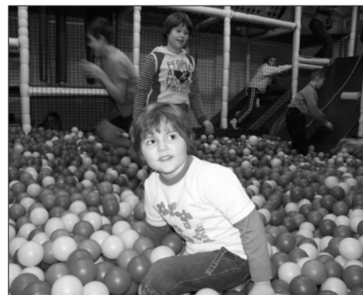
Uśmiech na twarzy dziecka to najlepsza zapłata