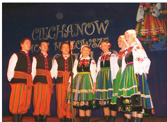
Śpiewacy z LZA