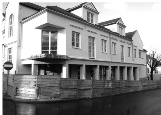
Jedną z większych inwestycji miejskich jest budowa biurowca przy ul. Wodnej

— opracowanie koncepcji odprowadzenia wód opadowych i roztopowych z dróg na terenie miasta wraz z inwentaryzacją istniejącej sieci deszczowej i rowów odwadniających