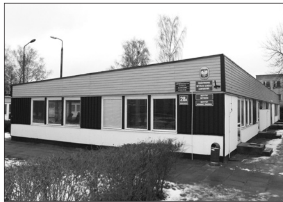
Tu mieści się aula ciechanowskiej PWSZ

ono w Ciechanowie swoistą tradycję. Jest też szansa powrotu do kierunków rolniczych.