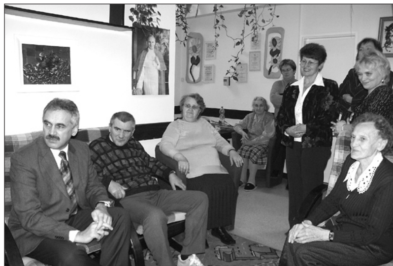
Prezydent miasta rozmawiał z pensjonariuszami Dziennego Domu Seniora

lił ich życzliwość i sprawność obsługi interesantów. Rozmawiał na temat codziennej pracy w prowadzonym przez placówkę Środowiskowym Domu Samopomocy, noclegowni dla osób bez-