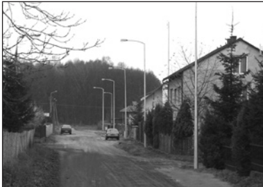
Słupy oświetleniowe na ul. Klonowskiego

Trwają prace ziemne przy budowie oświetlenia ulicznego na Andersena. Wykonuje je firma PUI-R Energetyka Wojciecha Brała. Zakończenie robót jest planowane na połowę grudnia. Oświetlenie będzie kosztować około 40 tys. zł.