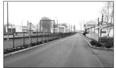
Nakładka na ul. Towarowej

Przedsiębiorstwo Transportowo-Handlowe „WAPNOPOL” z Głinojecka wykonało nakładkę bitumiczną w ulicach Towarowej, Zagłoby, Księcia Janusza i Waryńskiego (od ul. Kraszewskiego do Dąbrowskiego).