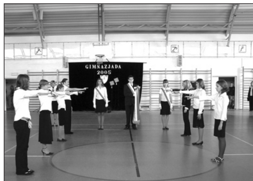
Ślubowanie klas pierwszych