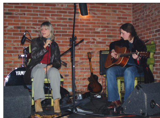
Zaduszki bluesowe uświetnił zespół Blue Sounds

Po zadumie i doznaniach metafizycznych przyszedł potem czas na nieco inne uczucia. Dostarczył ich Easy Rider, z liderem Andrzejem Wodzińskim na czele. Przy muzyce tego zespołu publiczność mogła dać upust radośniejszym emocjom. To był naprawdę sympatyczny i bardzo potrzebny koncert. Z pewnością nikt z wypełnionej po brzegi sali nie żałował, że właśnie w taki sposób spędził ten jesienny wieczór.