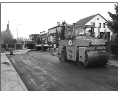
Ul. Dąbrowskiej w trakcie prac

Budowa odwodnienia i nawierzchni ulicy Obozowej rozpoczęła się w połowie października. Dokumentację techniczną tej inwestycji wykonała firma „WILECH” z Ciechanowa. Pierwszy etap prac obejmował modernizację oświetlenia ulicznego na istniejących słupach linii elektrycznej. Na odcinku od ul. Granicznej do Przytorowej wykonane zostały odwodnienie, w ulicy oraz na zjazdach do posesji położono kostkę betonową. A.G.