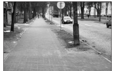
Nowy chodnik na ul. Sienkiewicza

Wyłoniona w przetargu nieograniczonym firma Budowa i Remont Dróg i Mostów z Ciechanowa wymieniła nawierzchnię chodnika po lewej stronie ul. Sienkiewicza (na odcinku od wjazdu do siedziby RUCH do Powiatowego Zarządu Dróg). Chodnikowe remonty przeprowadzone zostały także na ulicach: Ściegiennego (lewa strona od wjazdu na parking Banku Spółdzielczego do Zielonej Ścieżki), Małgorzackiej (prawa strona) i Sierakowskiego (prawa strona od ul. Małgorzackiej do Pijanowskiego).