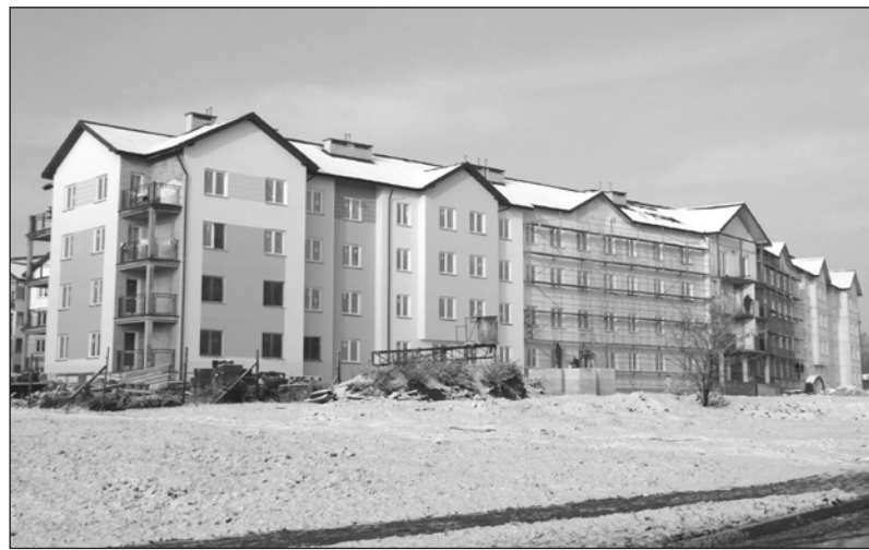
Kredytowe wsparcie przyspieszyło prace wykończeniowe

obiekту oraz porządkowaniu terenu przeznaczonego na parking. Oddanie budynku opóźniło się z powodu przedłużających się formalności, związanych z przyznaniem kredytu. Prawdopodobnie pierwsi lokatorzy wprowadzą się w marcu przyszłego roku. Całość inwestycji będzie kosztowała około 5,6 mln zł. red.