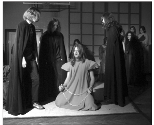
Dźwięk skrzypiec, zapach kadzidła, efekty świetlne, upiory oraz surowy chór nadawał przedstawieniu nastrój grozy. Najbardziej „ziemską” postacią był Guślarz, który utrzymywał kontakt zarówno z duchami, jak i z publicznością. Aktorzy grali na emocjach widzów: raz wywoływali

w nich współczucie dla aniołków czy niewinnej dziewczicy, raz skłaniali do potępienia straszego widma. Ten wysiłek sceniczny został nagrodzony brawami. — Najważniejszy jest dla nas uśmiech i duma rozpięta naszych bliskich..., a jeśli przy okazji sprawiamy komuś przyjemność, to jest to pełen sukces — powiedziała jedna z aktorek Inicjatywnej Grupy Teatralnej. Słowa te najlepiej odzwierciedlają