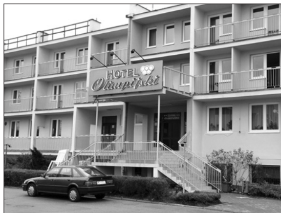
Hotel Olimpijski zyskał lepszy wygląd

W miejskim budżecie zaplanowano na te remonty kwotę 150 tys. zł. Zyskała zewnętrzna elewacja budynku. Ściany zostały docieplone styropia-