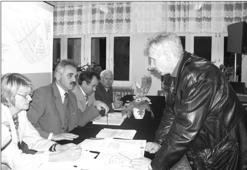
Podczas spotkania mieszkańcy osiedla dowiedzieli się o zasięgu i harmonogramie prac

Ruszyły prace na osiedlu Zachód. Do końca października 2006 r. zostaną tam zbudowane 24 ulice: od kanalizacji deszczowej i sanitarnej po nawierzchnie dróg, chodniki oraz brakujące oświetlenie. 24 października prezydent Waldemar Wardziński przedstawił mieszkańcom osiedla zasięg i harmonogram prac, podzie-