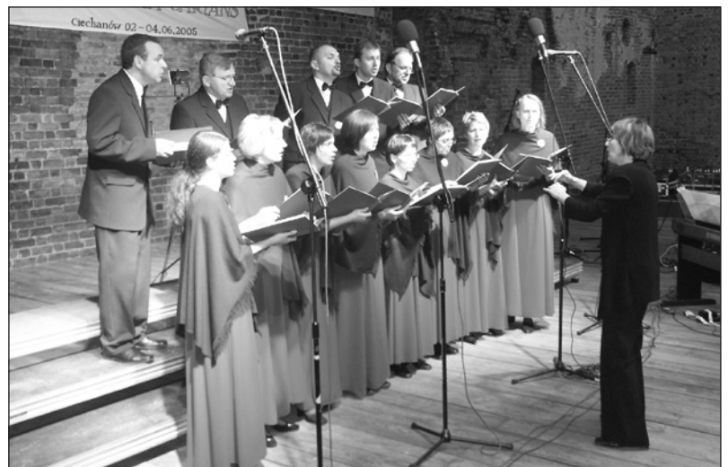
Występy Sine Nomine cieszą się dużą popularnością

Na XXXIV sesji miejscy radni postanowili wystąpić do Marszałka Województwa Mazowieckiego o przyznanie Dorocznej Nagrody dla SINE NOMINE. Od niemal siedmiu lat chór śławi nasze miasto w Polsce i poza granicami kraju. Wystąpił w ponad 100. koncertach. Zdobył liczne nagrody i wyróżnienia, między innymi drugą (2001) i dwukrotnie trzecią (2002 i 2005 r.) nagrodę w Ogólnopolskim