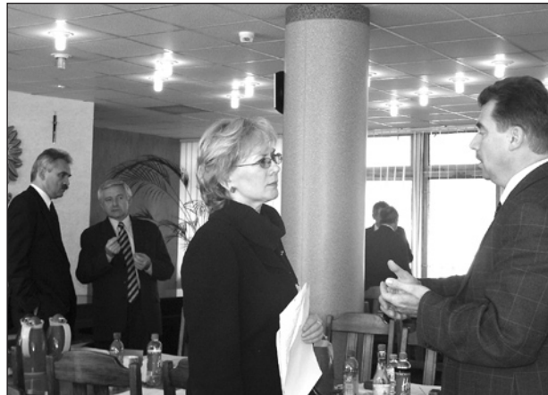
W przerwie obrad trwa dyskusja w dwuosobowych zespołach

XXXIV sesję Rady Miasta zdominowały kwestie ekonomiczne: przesunięcia budżetowe, skomplikowane finanse TBS, przebieg realizacji miejskich inwestycji. W dyskusji o miejskiej kulturze też co chwila mówiono o pieniądzach.