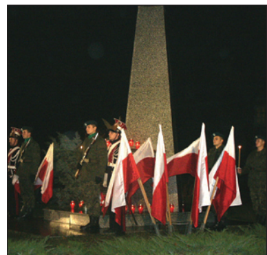
Uroczystości zaczęły się o zmroku