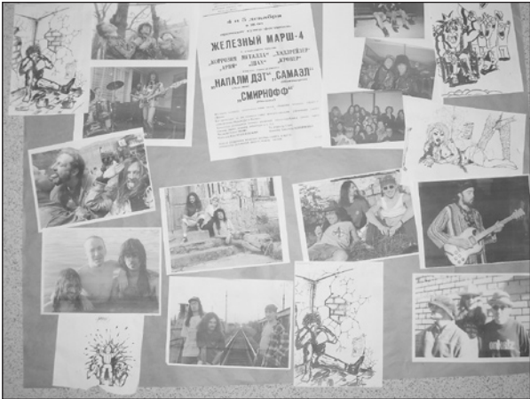
Wspomnienia przywoływały zdjęcia zespołu i przyjaciół, plakaty oraz rysunki

Po siedmiu latach nieobecności na scenie muzycznej (w takim składzie oczywiście) 28 października Smirnoff powtórnie stanął w świetle reflektorów. Po drugiej stronie oprócz wiernych fanów z dawnych lat — nowi, młodzi, zapewne niepomniający czasów muzycznych podbojów tego zespołu,