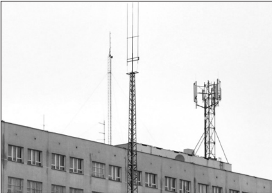
Stacje bazowe i maszty telefonii cyfrowych widoczne są w różnych punktach miasta

W czerwcu tego roku pełnomocnik Polskiej Telefonii Cyfrowej wystąpił do Wydziału Urbanistyki i Architektury Urzędu Miasta Ciechanów z wnioskiem o ustalenie lokalizacji inwestycji celu publicznego dla planowanej budowy stacji bazowej