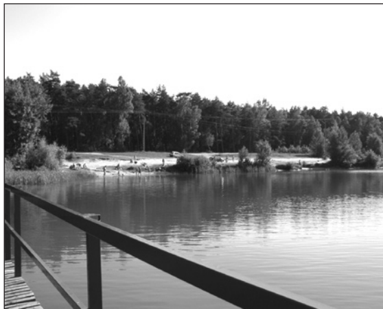
red. Teren rekreacyjny wokół zbiornika na Krubinie jest stale zaśmiecany

Pięciu pracowników MOSiR-u sprzątało teren wokół zbiornika wodnego na Krubinie. Wywieziono stamtąd trzy przyczepy śmieci. Nie należy mieć większych złudzeń, że dzięki wysypiska znów się nie pojawią w lesie i okolicznych zarostach po najbliższym weekendzie. Jak twierdzą mieszkańcy pobliskich posesji, do lasu wciąż są podrzucane śmieci z sąsiedniej Gminy Sońsk.