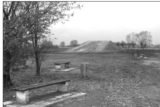
Zimna góra będzie atrakcją dla dzieci