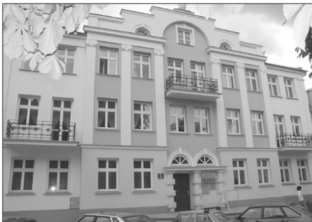
Zabytkowa kamienica przy Placu Kościuszki

Organizatorzy Ogólnopolskiego Konkursu „Modernizacja Roku”, służącego promowaniu rozwiązań architektoniczno-budowlanych, zapraszają