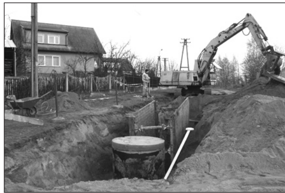
Budowa kanalizacji deszczowej w ulicy Różyckiego

W październiku rozpoczął się pierwszy z siedmiu etapów t.zw. inwestycji „Zachód”. Do końca października przyszłego roku na tym osiedlu zostaną kompleksowo zbudowane 24 ulice: od kanalizacji deszczowej i sani-