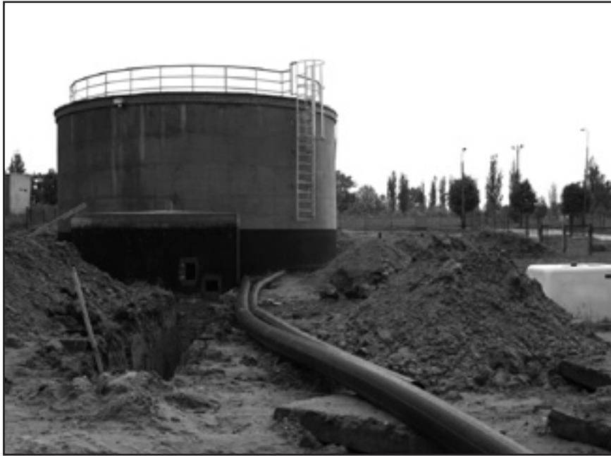
Modernizacja SUW – Tysiąclecia

Obecnie modernizowana jest Stacja Uzdatniania Wody – Tysiąclecia. Realizacja zadania jest utrudniona z powo-