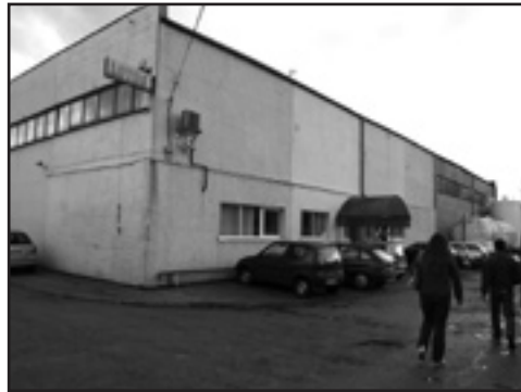
Przysła siedziba firmy HIT Electronics przy ul. Śmiecińskiej