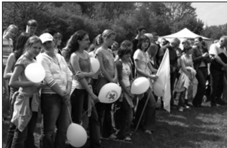
W działalności PCK angażuje się wielu młodych ludzi