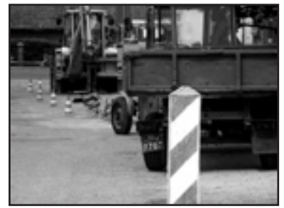
Prace na ul. Smorawińskiego

Zakończył się już remont ul. Powstańców Wielkopolskich i Armii Krajowej. Położono tam nowe nakładki asfaltowe. Prace naprawcze w obrębie skrzyżowania ulic Armii Krajowej i Sikorskiego prowadzone były nocą, by nie utrudniać ruchu. Oznaczenia poziome na wyremontowanych ulicach