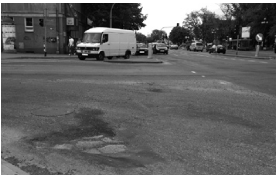
Skrzyżowanie dróg krajowych nr 50 i 60 w centrum Ciechanowa