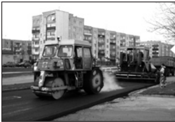
Dziś ul. Powstańców Wielkopolskich ma nową, gładką nawierzchnię