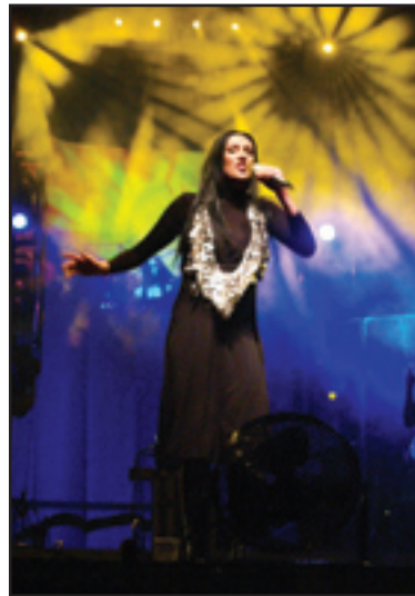
Kayah dała prawdziwe show

Na scenie plenerowej, wzniesionej na parkingu przed krytą pływalnią, zaprezentowały się zespoły z Centrum Kultury i Sztuki, kapele oraz strażackie orkiestry dęte z Ciechanowa, Su-