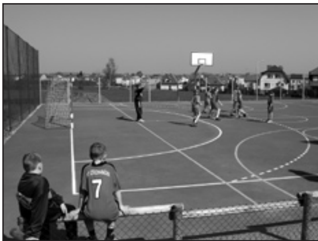
Takie boiska powstaną przy innych miejskich szkołach

program budowy kolejnych boisk oraz modernizacji bazy sportowej na stadionie. Wszystko po to, aby dzieci i młodzież miały gdzie spędzać wolny czas i doskonalić się w sporcie – wyjaśniał