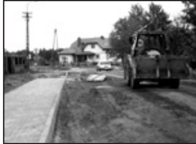
Budowa ul. Różyckiego

Roboty ruszyły z początkiem kwietnia. Są one kontynuacją wieloletniej miejskiej inwestycji – rozbudowy i modernizacji systemu kanalizacji osiedla Zachód w Ciechanowie. Teraz trwają prace przy budowie kanalizacji deszczowej i chodników w ulicach Różyckiego, Wolskiego, Modrzejewskiej i Paderewskiego.