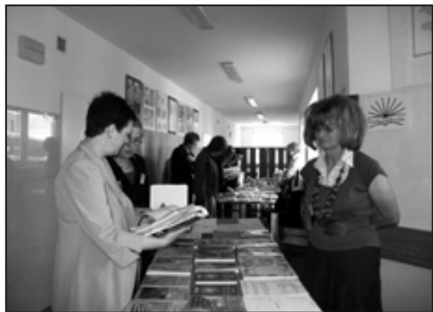
Oprócz konferencji zorganizowano stoiska z fachową literaturą