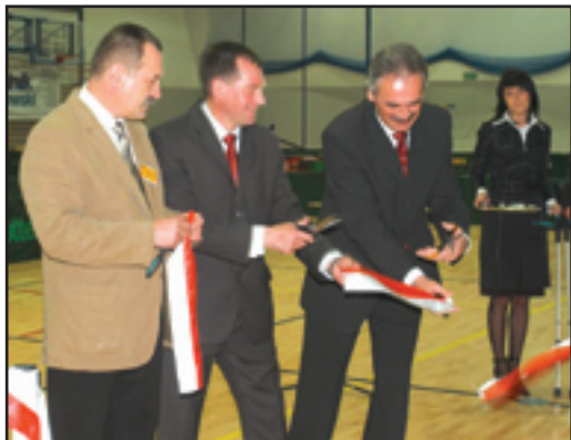
Uroczyste przecięcie wstęgi