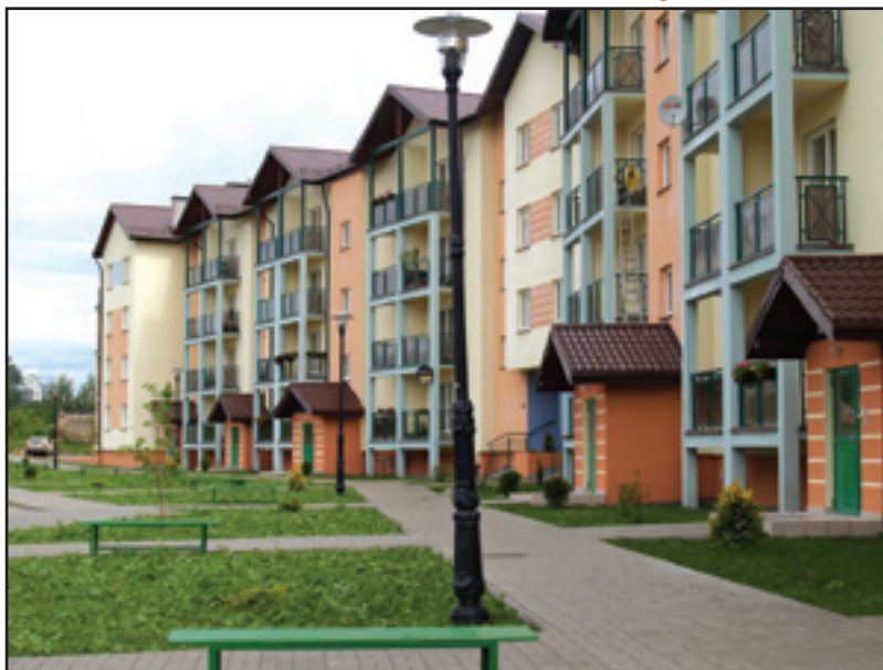
TBS zadbał o estetyczne wykończenie budynku i otoczenia

Nowy blok mieszkalny Towarzystwa Budownictwa Społecznego przy ul. Witosa został zasiedlony. TBS zadbał nie tylko o dobre wykończenie lokali, ale także o estetyczne zagospodarowanie otoczenia budynku. Zrobiono chodniki, posadzono drzewka i wysiano trawę. W szczycie bloku postawiono 4 garaże na wynajem. Powierzchnia użytkowa budynku to 3554 m 2 .