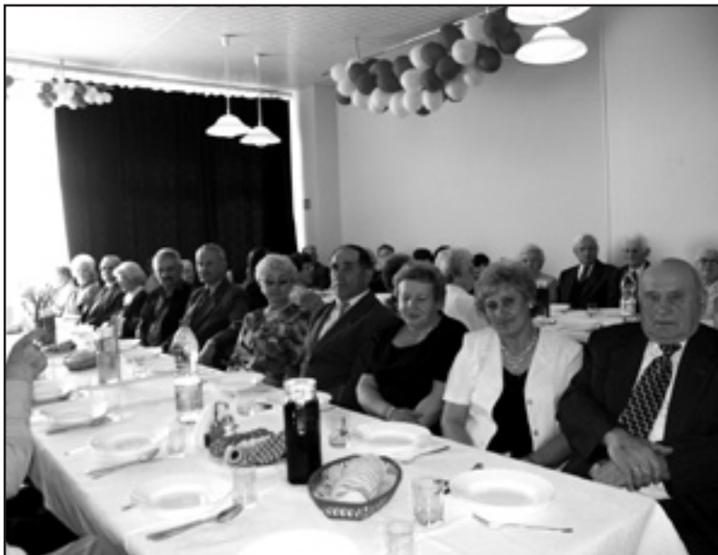
Spotkanie było okazją do bliższego poznania się

trzech do jak największej liczby osób oraz władz różnych szczebli z przesłaniem o konieczności niesienia pomocy osobom starszym i chorym. Na okolicznościowe spotkanie 27 kwiet-