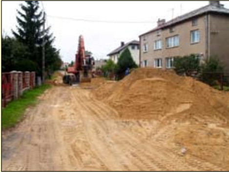
Na ul. Ogrodowej powstaje kanalizacja wodociągowa

We wrześniu plac budowy ulicy Ogrodowej został przekazany wykonawcy robót. Powstaje tu właśnie kanalizacja deszczowa. Przetarg na budowę wygrał Zakład Instalacji Sieci Gazowych, Wod.-Kan., Energetycznych, Handlu i Usług M.M. Młynscy z Ciecchanowa. Cena wybranej oferty to prawie 1 252 tys. zł. Planowany termin wykonania prac upływa 30 listopada.