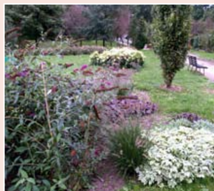
Uroki parku M. Konopnickiej