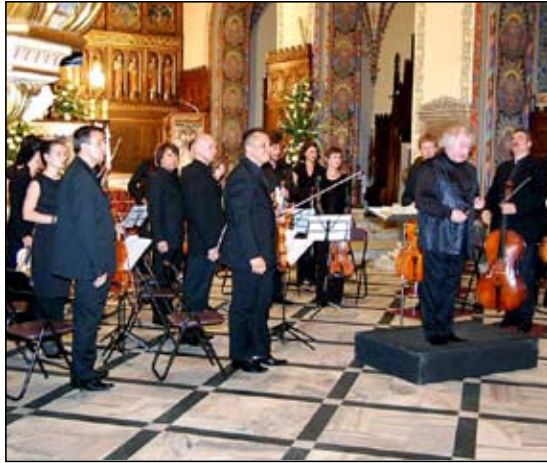
Koncert w rocznicę Porozumień