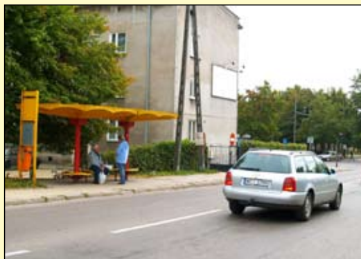
Po przebudowie przystanku autobusy nie będą blokować skrzyżowania

Budowa zatoki znacznie upłyni ruch i poprawi bezpieczeństwo na drodze. Miasto opracowało już dokumentację projektowo-kosztorysową budowy. Inwestycja musi być poprzedzona przebudową kolidującej infrastruktury podziemnej. Do przetargu na wykonanie robót stanęły 2 firmy. Trwa sprawdzanie dokumentacji przetargowych.