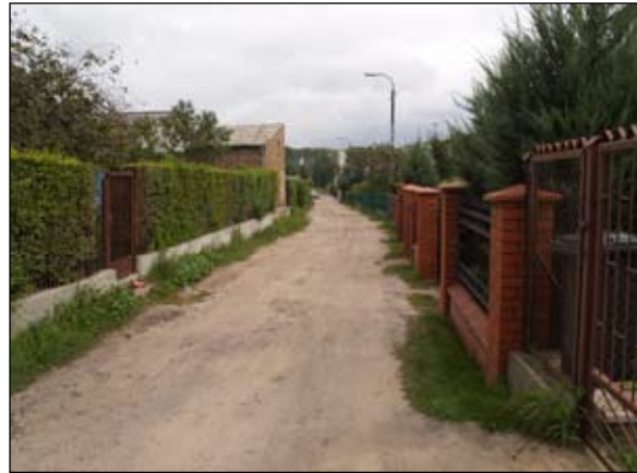
Mieszkańcy Olchowej tracą na sąsiedzkim konflikcie

Mieszkańców ul. Olchowej bardzo ucieszyło umieszczenie budowy ich ulicy w tegorocznym miejskim planie inwestycyjnym. Prace miały się rozpocząć w III kwartale roku. Miały, bo mimo zabezpieczenia w budżecie pieniędzy i wykonania dokumentacji projektowo-kosztorysowej inwestycja nie zostanie zrealizowana w tym roku.