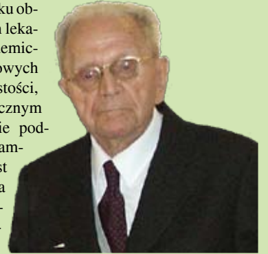
red. Stuletni Honorowy Obywatel Ciechanowa