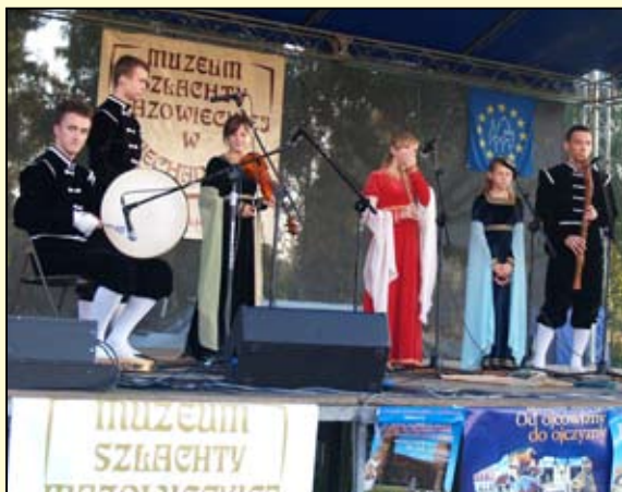
Ciechanowski zespół „Horrendus”

Organizatorzy: Mazowieckie Centrum Kultury i Sztuki w Warszawie, Urząd Miasta Ciechanów oraz Stowarzyszenie Artystyczne Makata.