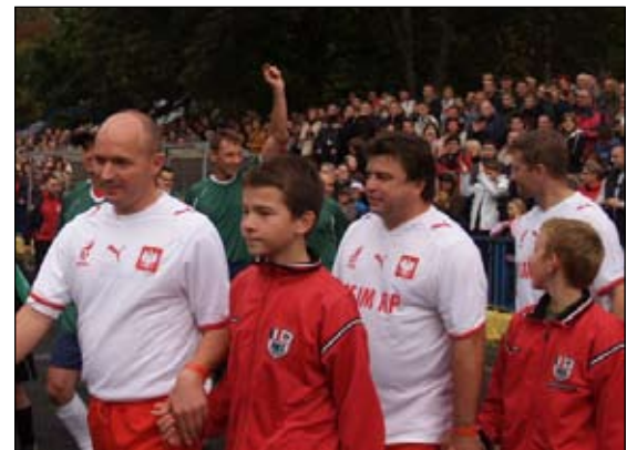
Gwiazdą Sejmiku RP był R. Kosecki (w środku)