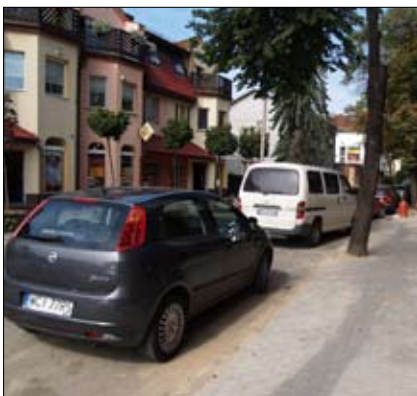
Zielona Ścieżka zostanie włączona do strefy płatnego parkowania