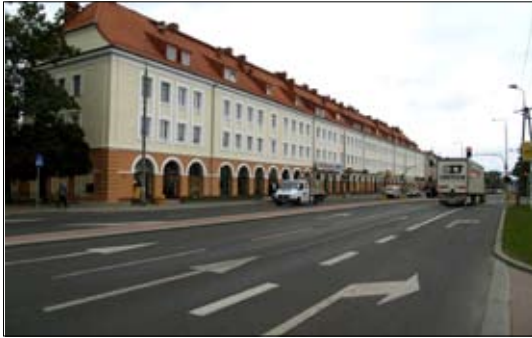
Nowe oblicze Hali Pułtuskiej

Hala Pułtuska to jeden z budynków najbardziej rozpoznawalnych, od dawna wpisanych w krajobraz naszego miasta. Położona przy ruchliwej drodze krajowej nr 60 jest też pierwszą wizytówką Ciechanowa dla wielu przyjezdnych. Dzięki gruntownemu remontowi elewacji (a wcześniej dachu) jej wygląd znacznie się poprawił.