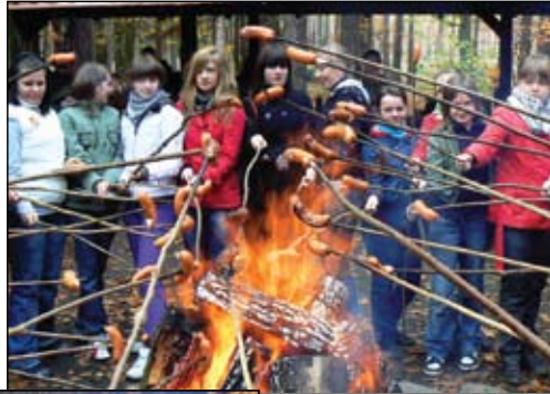
Leśni ludzie z Gimnazjum Nr 3