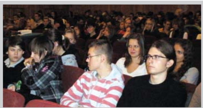
Projekcjom przyglądała się głównie młodzież ciechanowskich szkół