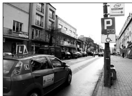
W strefie płatnego parkowania są wyznaczone miejsca dla niepełnosprawnych

Mija rok od wprowadzenia strefy płatnego parkowania w centrum miasta. Decyzja o jej utworzeniu okazała się słuszną. Dziś nie ma problemu z parkowaniem na Warszawskiej i w jej otoczeniu. W ciągu kilku miesięcy działania strefy kilkakrotnie korygowano jej regulamin, by jak najlepiej służyła mieszkańcom Ciechanowa. Czy umiemy z tego dobra korzystać tak, by się przed sobą nie wstydzić?