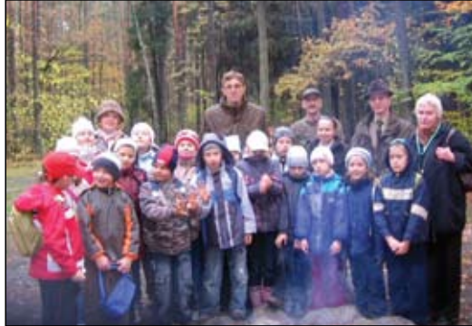
Dzieciaki z „Piątki” na ścieżce edukacyjnej

kujących las zwierzętach i uczestniczyły w konkursach odgadywania tropów oraz rozpoznawania grzybów jadalnych i trujących. Oba wyjazdy zakończyły się ogniskami zorganizowanymi przez Nadleśnictwo Ciechanów.