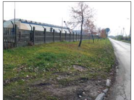
Tutaj będzie wybudowany nowy chodnik