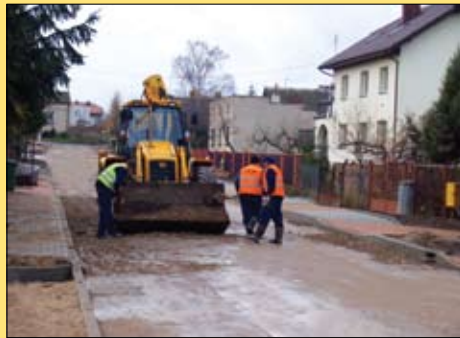
Powstaje jezdnia na ul. Ogrodowej

Wykonujący inwestycję Zakład Robót Inżynieryjno-Drogowych KAMIBUD z Ciechanowa planuje zakończyć prace do 19 grudnia.