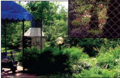
Zadbane otoczenie zwycięzcy konkursu w kategorii budynków użyteczności publicznej