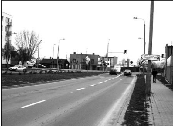
Ul. Armii Krajowej u zbiegu z Pułuską. Tędy przebiegać będzie pierwszy etap budowy wewnętrznej pętli miejskiej

10 września 2008 roku weszła w życie kolejna istotna zmiana specustawy. Dotychczasowe pozwolenie na budowę oraz decyzję o ustaleniu lokalizacji zastąpiła jedna decyzja o zezwoleniu na realizację inwestycji