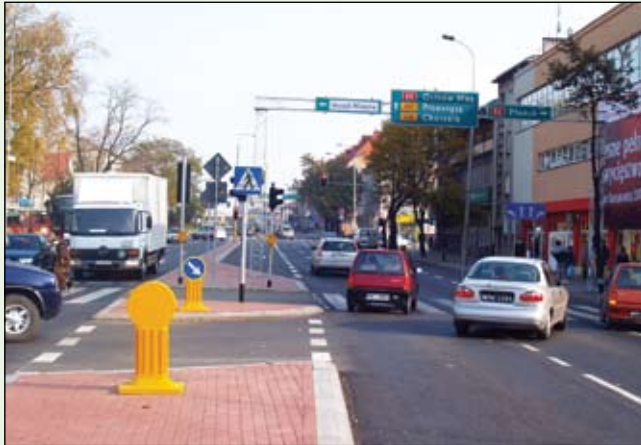
Samochody na przebiegających przez Ciechanów krajówkach znacznie przyczyniają się do zanieczyszczenia powietrza

W harmonogramie działań krótkoterminowych na lata 2008-2012 figuruje kilka bardzo ważnych inwestycji: budowa kanalizacji sanitarnej w ramach ciechanowskiej aglomeracji (inwestycja ZWiK za ok. 36 mln zł), budowa separatorów substancji ropopochodnych (do 2012 roku wydamy na to ok. 3,5 mln zł), rekultywacja terenów zdegradowanych i byłego składowiska w Kargoszyńcu. (300 tys. zł), usuwanie wyrobów zawierających azbest (300 tys. zł). ZKM w latach 2008-2009 przeznacza 3,5 mln zł na wymianę miejskich autobusów, a kolejne tereny w Ciechanowie planuje się objąć gazyfikacją. Wyprowadzenie ruchu komunikacyjnego z centrum poprzez budowę wewnętrznej pętli miejskiej (zadanie za 120 mln zł) spowoduje ograniczenie uciążliwości hałasu. Zainwestowanie przez ZWiK w nowe