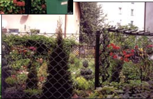
Zwycięski ogród w kategorii budynków wielorodzinnych