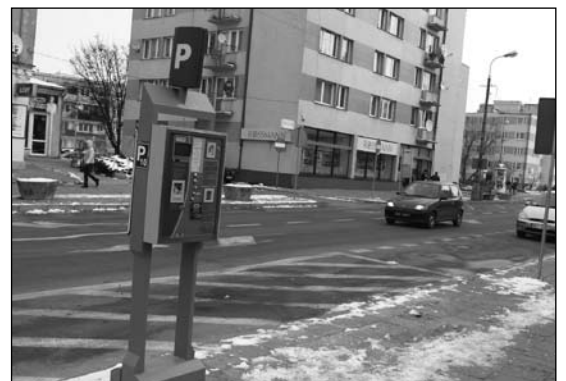
Nowy parkometr przy ul. Mikołajczyka