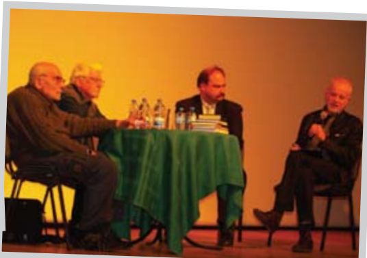
W panelach dyskusyjnych udział wzięli uznani publicyści, historycy i reżyserzy