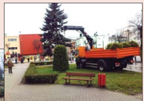
Demontaż kwietników na Placu Jana Pawła II

ok. 40 szt. skrzyń na piasek, który zimą służy do posypywania chodników i przejść dla pieszych. A.G.