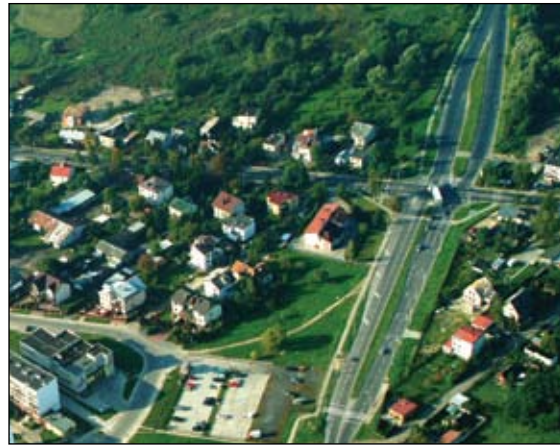
Jako pierwsze ruszą prace na ul. Armii Krajowej

Urząd Miasta przygotowuje dokumentację niezbędną do rozpoczęcia budowy miejskiej pętli, która odciąży zatłoczone centrum i lepiej skomunikuje dzielnice Ciechanowa. Pętla połączy drogi krajowe nr 50 i 60, drogi wojewódzkie nr 617 i 615 oraz siedem dróg powiatowych przebiegających w granicach miasta. Budowę wesprze Unia Europejska. Pieniądze