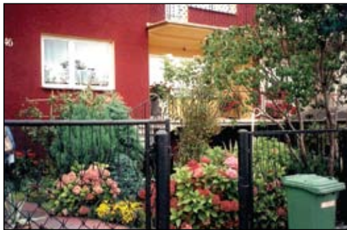
I nagroda w kategorii jednorodzinnych budynków mieszkalnych

Nagrody o łącznej wartości 4400 zł pochodzą ze środków Gminnego Funduszu Ochrony Środowiska i Gospodarki Wodnej. red.