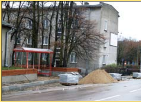
Trwa budowa przystanku przy ul. Kraszewskiego

Trwa budowa zatoki autobusowej przy ulicy Kraszewskiego. Przebudowano już kolidujące z inwestycją sieci telekomunikacyjne i energetyczne. Ustawiono też krawężniki, układana jest nawierzchnia chodnika z betonowej kostki.