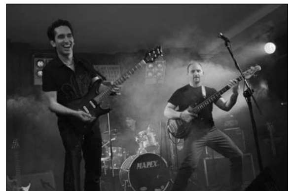
Muzycy formacji F3 dali popis – rozgrzali struny do czerwoności

Koncert niezwykle – ogromna energia wydobywająca się z szarpanych niemilosiernie strun wypełniała całą salę, aż w końcowej fazie koncertu dała upust w spontanicznych i szalonych płasach słuchaczy pod sceną. To wtedy właśnie kawiarniana