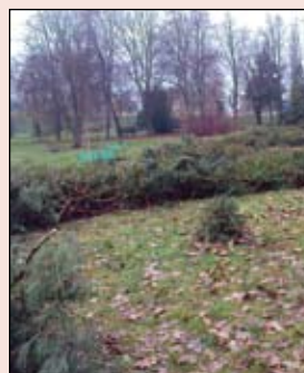
Róże w Parku M. Konopnickiej okryte igliwem

Dobiegło końca zbieranie i wywóz jesiennych liści. Pracownicy miejskiej zieleni okryli na zimę róże i inne rośliny wrażliwe na mroz. Zostały one przykryte igliwem lub okopcowane. Po pierwszych przymrozkach uprzątnięte zostały kwietniki, które zdobyły miasto wiosną i latem. Wrócą na swoje miejsce w przyszłym roku. Na terenie miasta rozstawiono