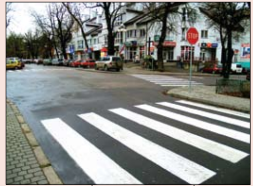
Skrzyżowanie ulic Ściegiennego, Zielonej Ścieżki i Strażackiej

Jesienna pora to dla kierowców czas utrudnionych warunków jazdy. Zwłaszcza wtedy ważne jest czytelne oznakowanie ulic. Urząd Miasta zlecił odnowienie oznakowań poziomych i pionowych na miejskich drogach. Odmalowane zostały przejścia dla pieszych na ul. Sienkiewicza, rondzie Meudon, a także na skrzyżowaniach ulic Ściegiennego, Zielonej Ścieżki i Strażackiej oraz Ściegiennego i Grodzkiej. Pomalowano też linie segregacyjne i strzałki kierunkowe na skrzyżowaniu ulic Sienkiewicza i Spółdzielczej. Na ul. Reutta wyznaczono miejsce dla osoby niepełnosprawnej, a na Nadfosnej wyznaczono nową i odnowiono istniejącą „kopertę” dla nie w pełni sprawnych użytkowników dróg. Wymieniono pionowe oznakowania w ul. Fabrycznej, Strażackiej oraz na Tysiąclecia przed niestrzeżonym przejazdem kolejowym. Wprowadzono ograniczenie prędkości do 40 km/godz. na odcinku ul. Augustiańskiej od skrzyżowania z ul. Orylską do mostu. Na bieżąco prostowane są znaki drogowe.