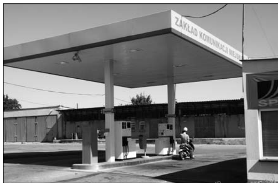
Stacja paliw Zakładu Komunikacji Miejskiej

na tej sali nie żyje w przekonaniu, że jakkolwiek przepis z dnia na dzień zmieni mentalność mieszkańca naszego miasta. Ale z czasem ma powstać dobry obyczaj zachowania się pasażera w autobusie – przekonywał radny. Położył też nacisk na konieczność szerokiej akcji informacyjnej.