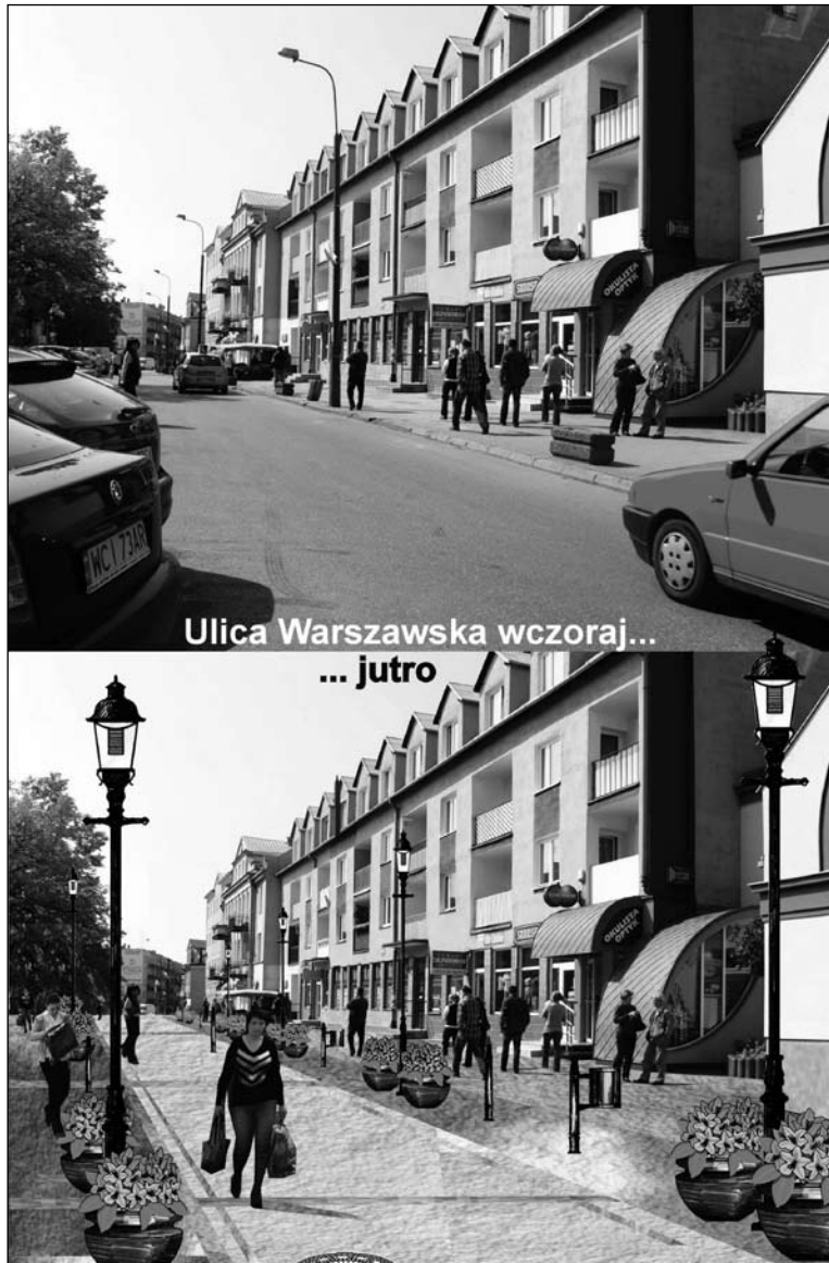
Wizualizacja autorstwa Marka Zalewskiego