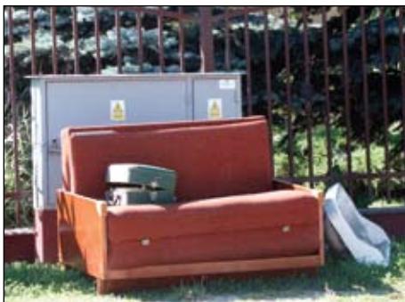
Mieszkańcy chętnie oddają stare meble zalegające na strychach i w piwnicach