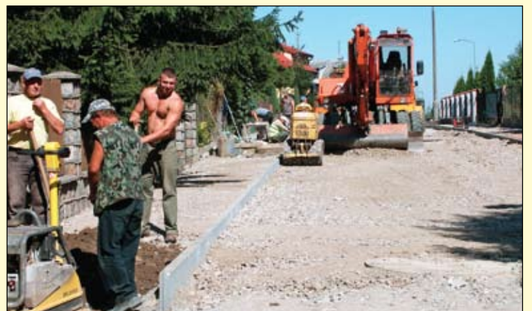
Wykonawca przygotowuje podłoże pod budowę jezdni