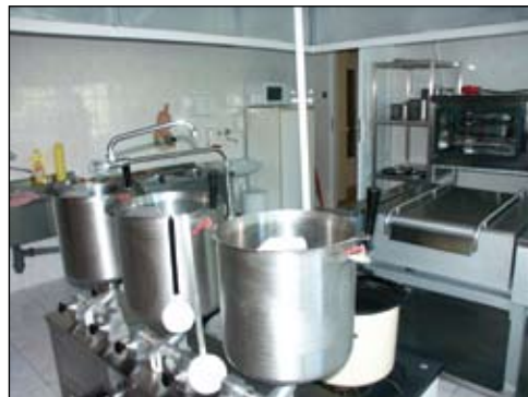
Zaplecze kuchenne Przedszkola Nr 5 aż lśni

W Przedszkolu Nr 4 wymieniono pokrycie dachowe wraz z obróbką blacharską, wentylatorami i instalacją przeciwpiorunową. Poprawiona została też elewacja budynku, a plac przed budynkiem zostanie utwardzony kostką. W Przedszkolu Nr 5 pomalowano korytarze i pomieszczenia socjalne oraz zamontowano nowe okna. W Przedszkolu Nr 6 wyremontowano kominy spalinowo-wentylacyjne.