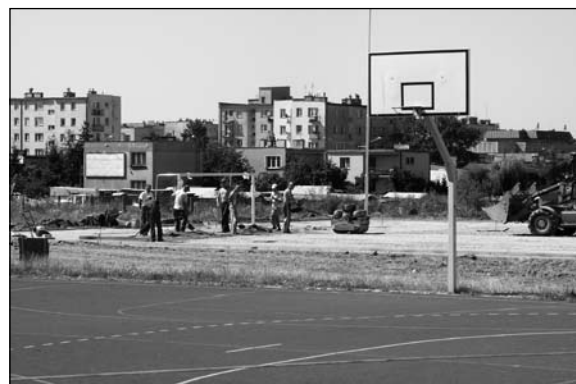
Orlik powstaje obok boiska o sztucznej nawierzchni oddanego do użytku w zeszłym roku

Ciechanów jest w grupie 44 miast starających się o bazę pobytowo – treningową dla jednej z drużyn finalistów Mistrzostw Europy w Piłce Nożnej Euro 2012. Żeby sprostać oczekiwaniom organizatorów czeka nas jeszcze wiele prac, które trzeba wykonać w przyszłym roku. Przygotowana jest już dokumentacja 2-letniej inwestycji: modernizacji i rozbudowy hotelu „Olimpijskiego”. To kosztowne, 17-milionowe zadanie. Miasto chce przeznaczyć na ten cel 9 mln zł ze swojego budżetu. – Pozostaną część chcemy uzyskać ze środków