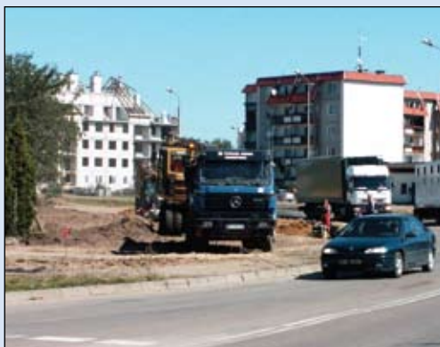
Tu w pobliżu skrzyżowania z ul. Słońskiego nowa droga łączy się z istniejącym już fragmentem Armii Krajowej

przewiduje opracowanie projektów budowlanych w ciągu 7, a projektów wykonawczych – 14 miesięcy od daty podpisania umowy. Szybsze opracowanie projektów budowlanych pozwoli na uzyskanie tzw. decyzji o zezwoleniu na realizację inwestycji drogowej (zgodnie ze znowelizowanymi przepisami jest to decyzja łącząca w sobie dawną decyzję lokalizacyjną i pozwolenie na budowę). Wydanie tej decyzji przez Starostę Ciechanowskiego otworzy drogę do podpisania umowy o dofinansowaniu zadania ze