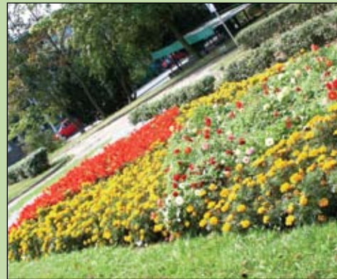
Zadbane rabatki to ozdoba miasta

Latem, podczas upałów szczególnej troski wymaga roślinność na skwerach i zieleńcach. Często i obficie podlewana nie więdnie i długo zdobi klomby i rabatki. Na zlecenie Urzędu Miasta dba o nią Przedsiębiorstwo Usług Komunalnych. Pracownicy zieleni przywożą wodę beczkownikami i codziennie zasilają rośliny. W różnych rejonach miasta odchwaszczane są krzewy. Trwa koszenie traw. Wykoszono pasy drogowe w dzielnicach Bloki i Krubin, w parku M. Konopnickiej i J. Dąbrowskiego, na ul. Tysiąclecia, Fabrycznej i Szwanke oraz terenach zielonych „Jeziorko” i przy ul. Czarnieckiego. Trawa będzie koszona przy ul. Wiosennej, Gąseckiej, na placu zabaw przy Wesolej oraz w innych rejonach miasta w miarę potrzeb.