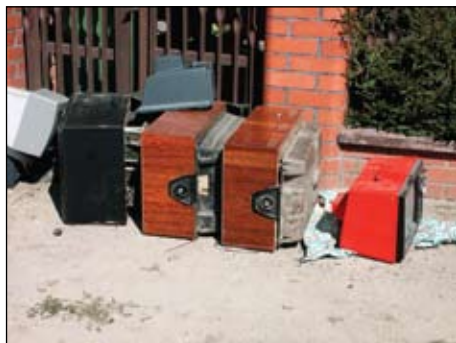
Zbiórka była okazją do pozbycia się „zapasu” zepsutych telewizorów

Już teraz możemy powiedzieć, że okazja do bezpłatnego pozbycia się starych mebli, zużytego sprzętu elektrycznego i elektronicznego (pralek, lodówek, telewizorów itp.) bardzo zainteresowała mieszkańców, którzy chętnie ustawiają niepotrzebne sprzęty przy pojemnikach na śmieci. Ich odbiorem zajmuje się PUK. Wyładowane po