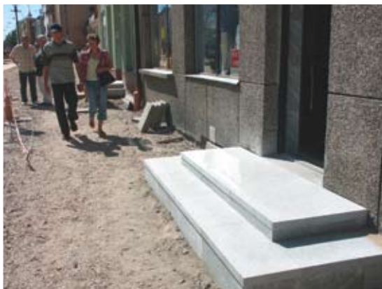
Przed drzwiami do sklepów powstają jednolite granitowe schody