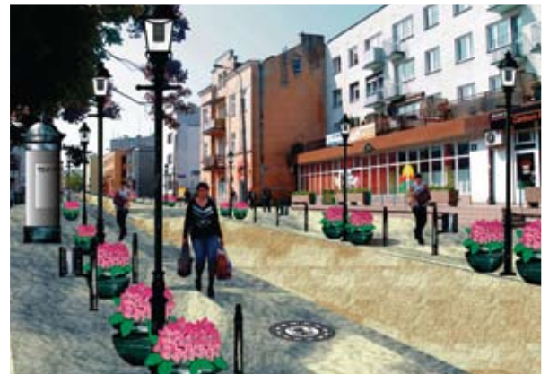
Przyszły wygląd ul. Warszawskiej

stanie w dodatkowo wygospodarowane miejsca parkingowe. Około 60 miejsc postojowych wyznaczono podczas zakończonej w tym roku przebudowy ul. 11 Listopada i Nowozagumiennej. W planach są remonty kolejnych ulic: Nadfosnej, Kilińskiego, Sierakowskiego, Małgorzackiej, Kopernika, Strażackiej. Rozpoczęła się także budowa nowej drogi wzdłuż Łydyny. Tu także będą miejsca dla samochodów. Na niektórych śródmiejskich ulicach zmieni się organizacja ruchu. Dzięki zwię-