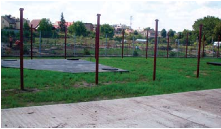
Separator został już zagłębiony w ziemi, a teren ogrodzony

Instalowany właśnie trzeci separator substancji ropopochodnych będzie odbierał wody opadowe z rejonu ulic: Wojska Polskiego, Zagumiennej, Ukośnej, Willowej i całego osiedla Powstańców Wielkopolskich. Obecnie trwają prace przy ujściu kolektora deszczowego do rzeki, tzw. gabionami wzmocnione są brzoży Łydyni. Modernizacja kolektora deszczowego wraz z separatorem kosztować będzie blisko 1,5 mln zł. Dzięki oszczędnościom i przesunięciom budżetowym budowa zakończy się jesienią tego roku, a nie