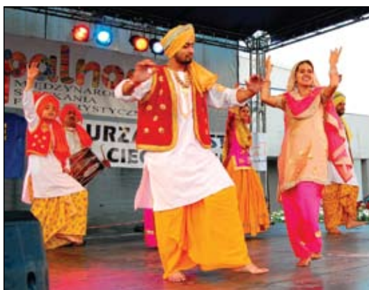
Kupalnocka daje możliwość poznania innych kultur. Na zdjęciu zespół z Indii

Zespoły z Indii, Łotwy, Rosji i Izraela przyjechały do Ciechanowa, by 4 lipca wystąpić w XVIII Międzynarodowych Spotkaniach Folklorystycznych KUPALNOCKA.