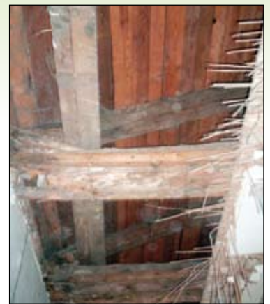
Widać, że ratusz musi być wyremontowany od fundamentów aż po dach