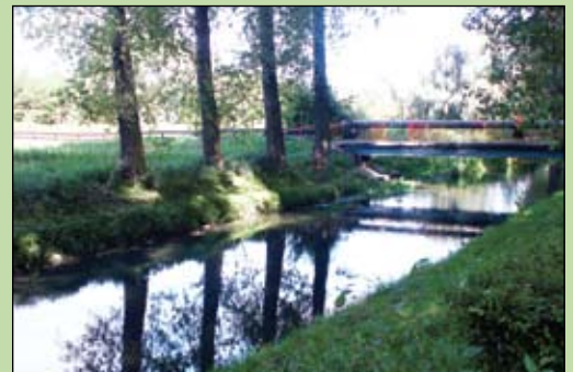
A.G. Malownicza Łydynia z wykoszonym dnem

Na zlecenie Urzędu Miasta pracownicy Rejonowego Związku Spółek Wodnych koszą dno Łydyni. Nasza rzeka jest wąska i niezbyt głęboka, co sprzyja szybkiemu zarastaniu roślinnością. Oczyszczanie dna rzeki jest ważne nie tylko ze względów estetycznych. Gęsta roślinność blokuje przepływ wody, która zaczyna szukać nowego koryta i podmywa brzoży.