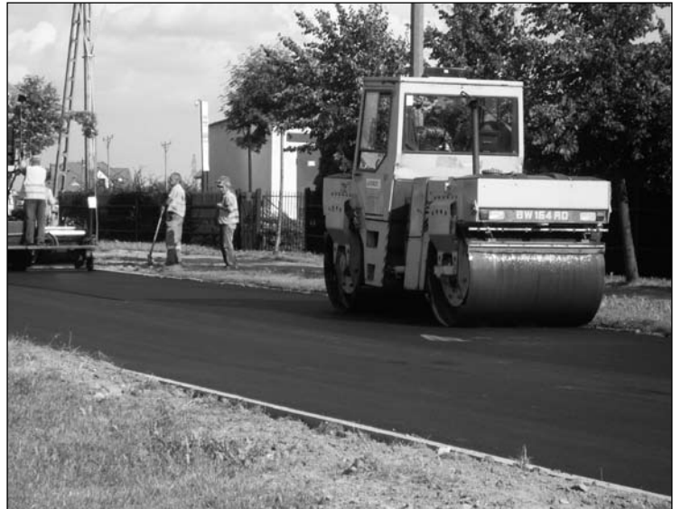
Ul. Batalionów Chłopskich czeka jeszcze położenie kolejnej warstwy asfaltu – trzeba wyrównać drogę do poziomu studzienek kanalizacyjnych