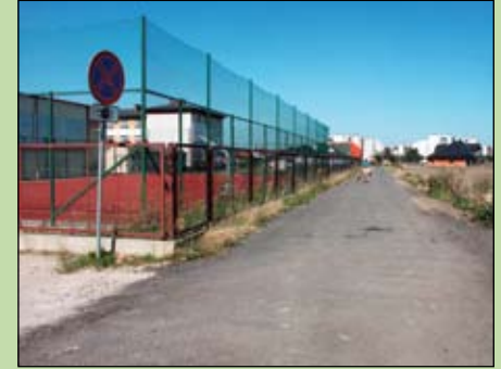
Utwardzona droga do SP Nr 4

Bieżącym utrzymaniem miejskich ulic w tym roku zajmuje się ciechanowska firma DELTA-PRID. Na zlecenie Urzędu Miasta ekipy remontowe wykonały nawierzchnie z asfaltowego frezu na ul. Pogodnej, kilometrowym odcinku ul. Opinogórskiej, części ul. Błękitnej i na drodze do Szkoły Podstawowej Nr 4. Metoda ta pozwala na oszczędności dzięki powtórnemu wykorzystaniu asfaltu.