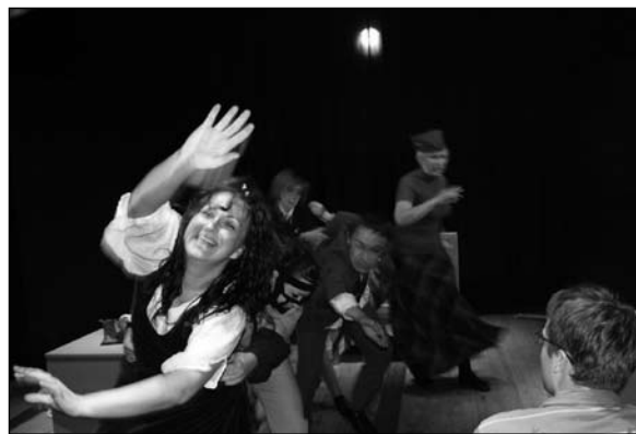
Szaleńcy na lokomotywie tuż przed katastrofą

na ostrze swego losu”. Upaja go pęd i własne słowa, którymi wyluszcza kompanowi filozofię ostatecznego rozwiązania – „zrobimy nagłe uderzenie w punkcie najmniej oczekiwanym”. Sęk w tym, że to uderzenie dotyczy też niewinnych ludzi. Ten fakt nie zaprzęta też Wojtaszka – Travaillaca. Ten z kolei jest zbyt prymitywny, żeby być