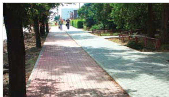
Można już korzystać z chodnika i ścieżki rowerowej od strony ul. Pułtuskiej