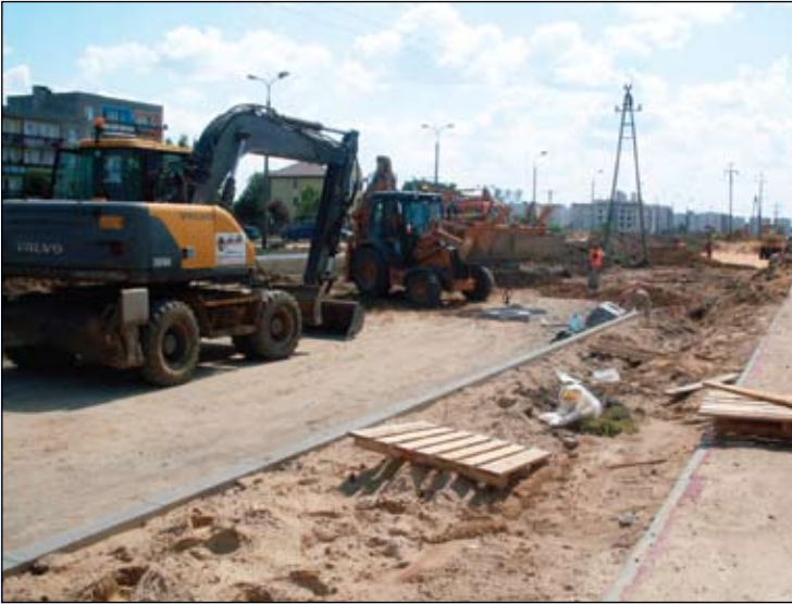
Powstaje druga nitka ul. Armii Krajowej

Trwa budowa ul. Armii Krajowej. Wykonawca – konsorcjum firm: Przedsiębiorstwa Budowy Dróg i Mostów z Mińska Mazowieckiego oraz PLANETA z Warszawy bardzo sprawnie prowadzi roboty, wyprzedzając w tej chwili harmonogram prac.