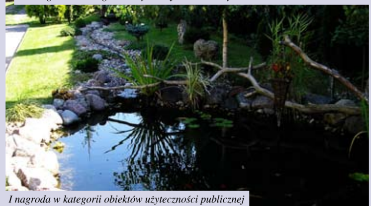
I nagroda w kategorii obiektów użyteczności publicznej