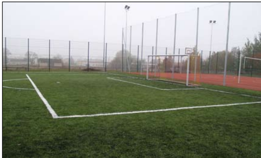
Obok boiska z trawiastą nawierzchnią wybudowano wielofunkcyjny obiekt do gier zespołowych

Orlik przy Miejskim Zespole Szkół Nr 1 jest już wybudowany. Otwarcie zaplanowano na 4 listopada. O godz. 11.00 nastąpi uroczyste przecięcie wstęgi i poświęcenie obiektu. Do dyspozycji młodzieży oddane zostaną dwa nowoczesne boiska: piłkarskie z nawierzchnią z syntetycznej trawy i wielofunkcyjne (do gry w siatkówkę i kosza)