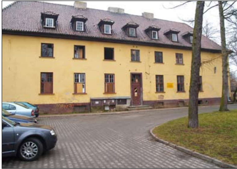
Sprzedaż poszpitalnego obiektu przy ul. Sienkiewicza 32 stała się przedmiotem sporu

Dużo emocji na 38 sesji Rady Miasta wzbudził projekt uchwały dotyczącej sprzedaży nieruchomości przy ul. Sienkiewicza 32. Znajdujący się tam budynek jest w bardzo złym stanie technicznym i kwalifikuje się do kapitalnego remontu.