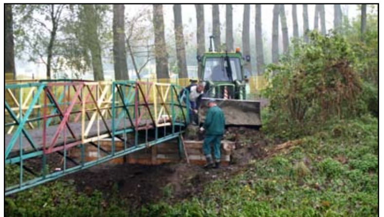
Kładka dla pieszych w remoncie

Rozpoczął się remont mostu na ul. Augustańskiej. Zadanie to wykonuje Przedsiębiorstwo Robót Mostowych BUDIMOST z Płońska. Prace potrwać do połowy listopada. Kładkę dla pieszych wyremontuje Rejonowy Związek Spółek Wodnych. W zakres prac remontowo-konserwacyjnych wejdzie także umocnienie brzegu i skarp, korpusów fundamentu i ścian przyczółków kładki.