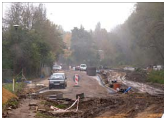
Na nowej ulicy położono już pierwszą warstwę asfaltu

W miejscu stojących przy nowej drodze garaży „blaszaków” powstanie parking. Kierowcy będą też mogli stawiać auta wzdłuż drogi. Przy wyjeździe w ul. 17 Stycznia będzie obowiązywał nakaz skrętu w prawo (tu miasto musiało przyjąć decyzję zarządcy tej ulicy – Generalnej Dyrekcji Dróg Krajowych i Autostrad). Dalsza część drogi (od Koper-