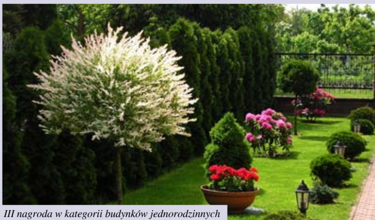
III nagroda w kategorii budynków jednorodzinnych