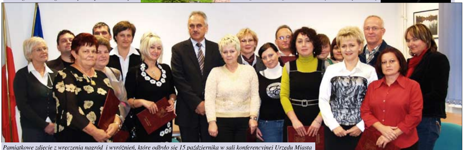
Pamiątkowe zdjęcie z wręczenia nagród i wyróżnień, które odbyło się 15 października w sali konferencyjnej Urzędu Miasta