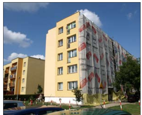
Budynek przy ul. Powstańców Wielkopolskich jeszcze podczas modernizacji