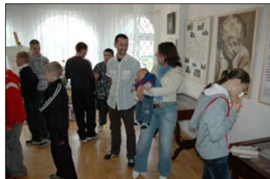
Wystawa zaciekała nawet dzieci

Autorka popularnej powieści „Noce i dnie” urodziła się na Ziemi Kaliskiej. Mieszkała i tworzyła na Mazowszu. Ekspozycja obejmuje wybrane wydarzenia z jej życia i prowadzi do miejscowości związanych z rodziną Szumskich, które pisarka uwieczniła w swoich „Dziennikach”. W licznych opowiadaniach ujawniła prawdziwie humanistyczną postawę. – Człowiek jest tajemnicą, z tajemnicy przybywa