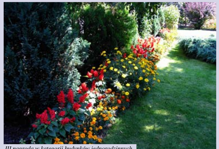
III nagroda w kategorii budynków jednorodzinnych