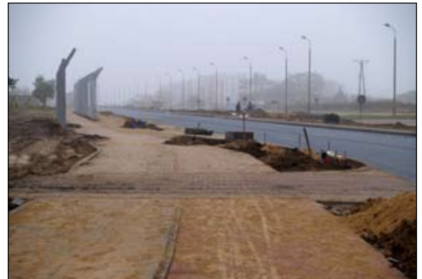
Wzdłuż ul. Armii Krajowej ustawiono słupy konstrukcyjne ekranów dźwiękochłonnych i latarnie