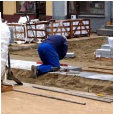
A.G. Żmudne układanie kostki na ul. Warszawskiej

Na dalszym odcinku – do skrzyżowania z ulicami Mikołajczyka i Ściegiennego – Zakład Wodociągów i Kanalizacji kończy budowę nowych przyłączy wodociągowych. Jeszcze w tym roku zostanie wykonana podbudowa z kruszywa pod nową nawierzchnię. Przyspieszone tempo robót (kostkę i płyty układają dwie ekipy pracowników) po części niweluje opóźnienia spowodowane prowadzonymi wcześniej badaniami archeologicznymi.