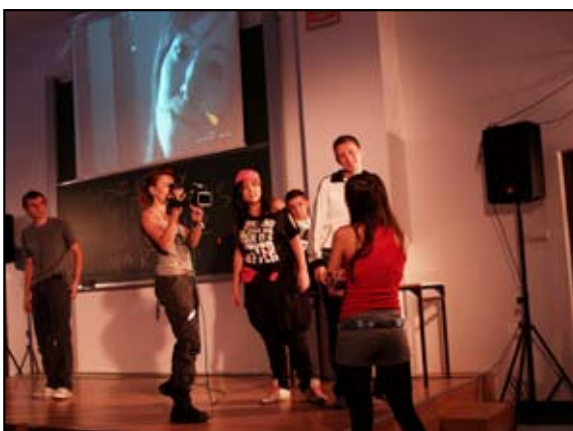
Przedstawienie na podstawie dramatu Z. Hołdysa