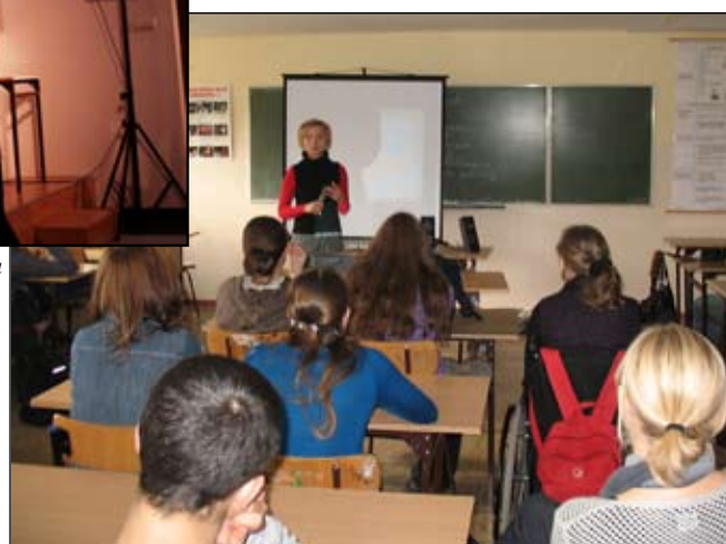
Pogadanka z młodzieżą w Gimnazjum Nr 4

Miejmy nadzieję, że w „Chemiczna pułapka” nie wpadną uczestnicy programu dla uczniów szkół ponad-