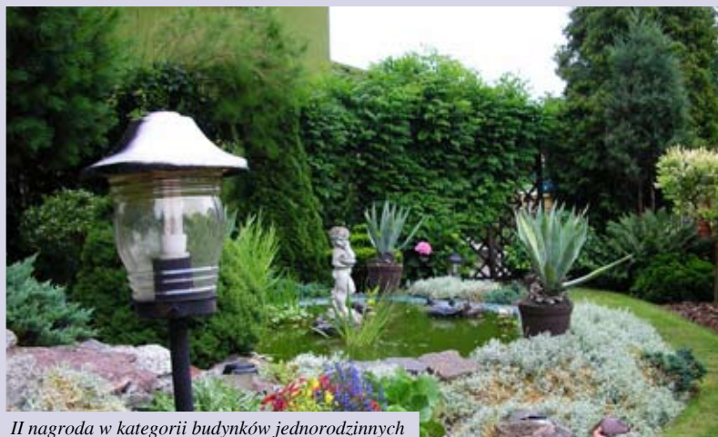
II nagroda w kategorii budynków jednorodzinnych