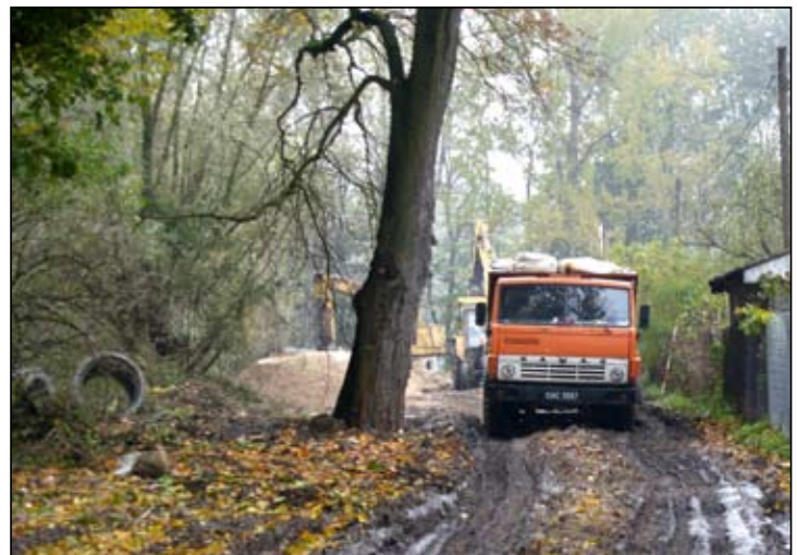
Ruszyła budowa separatora