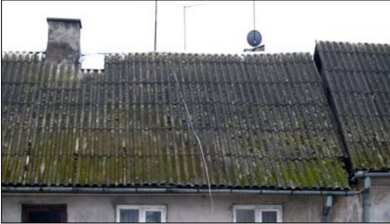
Miasto dofinansowuje demontaż azbestowych dachów

Eternit zawiera szkodliwy dla zdrowia ludzkiego azbest, szczególnie niebezpieczny gdy unosi się z pyłem ze skorodowanych płyt i jest nieświadomie wdychany. Dlatego właśnie ważne jest, by każdy właściciel budynku, którego pokrycie dachu lub okładziny ścian wykonano z eternitu lub innego wyrobu zawierającego azbest, dokładnie sprawdził jego stan i zaplanował wymianę. Usunięcie takich pokryć dachowych dofinansowuje Urząd Miasta.