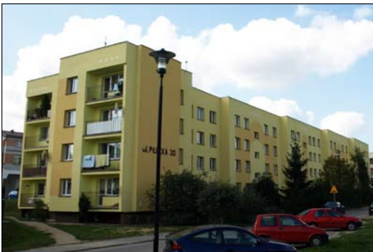
Wyremontowana elewacja bloku przy ul. Płockiej

Towarzystwo Budownictwa Społecznego administruje 202 budynkami z 3546 lokalami o łącznej powierzchni użytkowej 164 389 m 2 . Na tegoroczne konieczne prace remontowe TBS dysponował sumą nieco ponad 1 mln zł przekazaną z budżetu miasta. Potrzeby remontowe tradycyjnie już przekraczają możliwości finansowe spółki. Prace wykonane w tym roku były poważnym wyzwaniem.