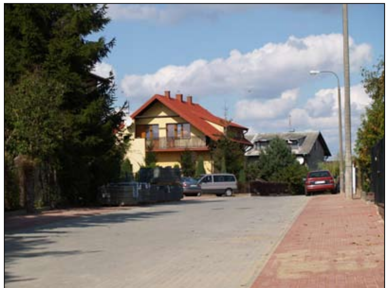
Mieszkańcy Rajkowskiego mają nową ulicę