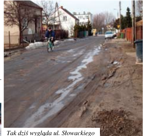
Tak dziś wygląda ul. Słowackiego

Dokumentację Perłowej sfinansowali sami mieszkańcy, dokumenty potrzebne do budowy Słowackiego i Gałczyńskiego są gotowe od 2008 r. – Mamy już pozwolenie na budowę ulic: Słowackiego i Gałczyńskiego.