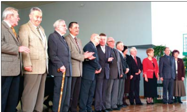
Radni pierwszej kadencji po 1989 r.