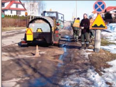
Likwidowanie dziur w nawierzchni ul. Szwanke

prezydenta Ewa Gładysz. Na bieżące utrzymanie dróg w tegorocznym budżecie zapisano 3 185 tys. zł, z czego na remonty cząstkowe przypada 933 tys. zł. – Zawsze te środki były niewystarczające, ale przy takich opadach śniegu i spustoszeniu, jakie zima uczyniła na naszych drogach przydatąby się kwota dwukrotnie wyższa. Oprócz dbałości o nawierzchnie musimy drogi odwadniać, oświetlać, wykaszować pobocza – przypomina wiceprezydent Gładysz.