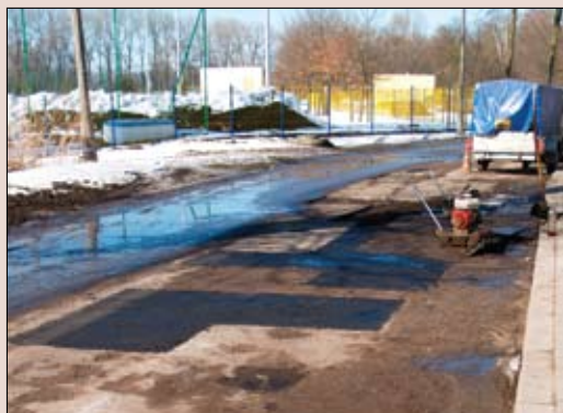
Zatamana ul. Augustiańska

Do tej chwili Urząd Miasta zlecił firmie DELTA-PRiD (wygrała przetarg na bieżące utrzymanie gminnych dróg) remonty cząstkowe ul. Mleczarskiej, Gwardii Ludowej, Ściegiennego, Sikorskiego, Augustiańskiej, Placu Jana Pawła II, Jesionowej, Gostkowskiej, Narutowicza, Wyzwolenia, Okrzei, Szwanke, Sienkiewicza (przy