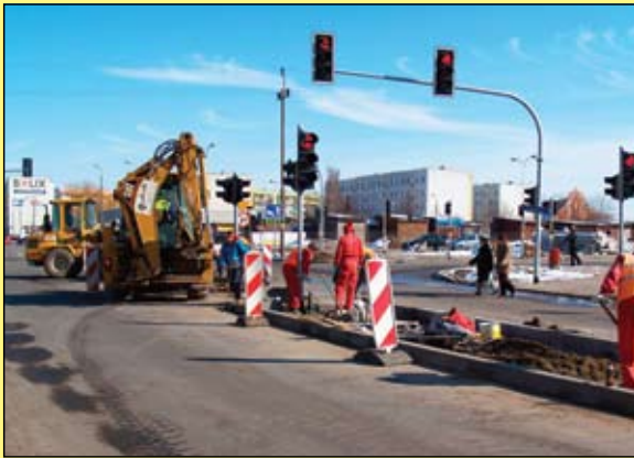
Na ul. Armii Krajowej robotnicy pojawili się już na początku marca

Zima się kończy, wkrótce pełną parą ruszą prace na drogach. U progu sezonu miejscy urzędnicy dopinają prace dokumentacyjne. Czekamy na wydanie decyzji o zezwoleniu na realizację inwestycji drogowej – wewnętrznej pętli miejskiej. Wniosek w tej sprawie 5 stycznia trafił do Starostwa Powiatowego w Ciechanowie. Trwają prace nad skompletowaniem pozostałych dokumentów niezbędnych do złożenia wniosku o dofinansowanie zadania ze środków unijnych: Studium Wykonalności oraz modelu ruchu dla miasta Ciechanowa. Kompletny wniosek ma być złożony wiosną 2010 r., po czym nastąpi jego ocena i podpisanie umowy o dofinansowanie. Chodzi o niebagatelną kwotę 102 mln zł (cała inwestycja ma kosztować 150 mln zł).