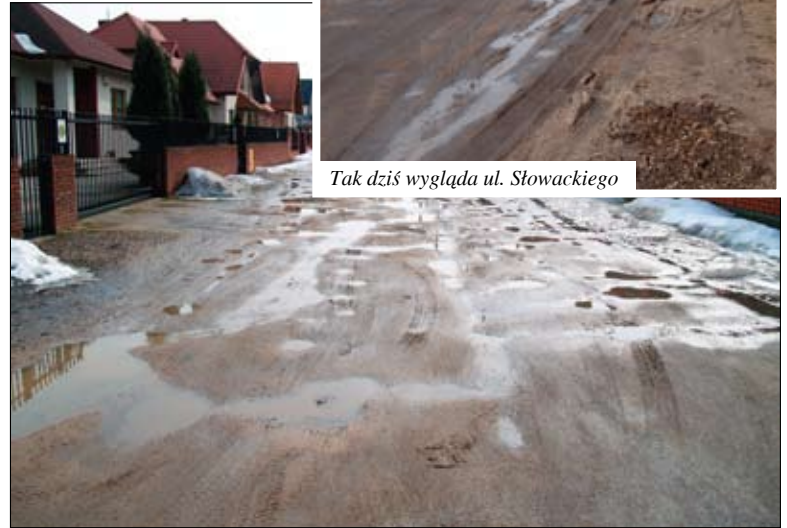
Na Perłowej trudno przejść suchą stopą