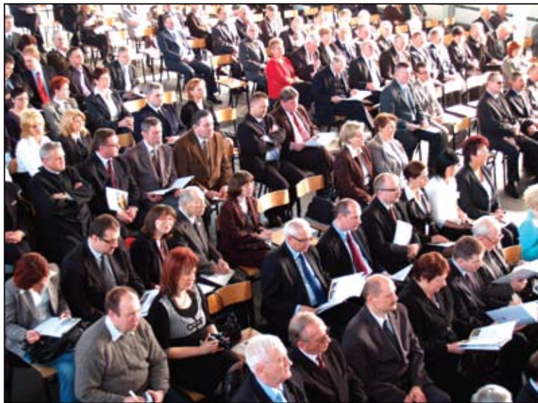
Wśród zaproszonych gości byli samorządowcy z sąsiednich gmin, działacze organizacji pozarządowych, dyrektorzy i prezesi instytucji publicznych oraz dziennikarze