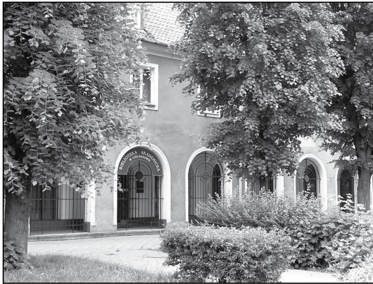
W tym budynku przy Pl. Piłsudskiego mieszczą się zbiory CTN

Ciechanowskie Towarzystwo Naukowe w ciągu ponad 40 lat działalności zgromadziło unikalny księgozbiór liczący ponad 50 tys. wydawnictw, roczników czasopism naukowych i regionalnych. Ok. 3,5 tys. woluminów to zbiór mazowianów. Zbiory CTN zawierają najpełniejszą dokumentację historii Ciechanowa i mogą w przyszłości stać się punktem wyjściowym pracowni dziejów miasta. Towarzystwa nie stać na samodzielne utrzymanie zbiorów i opłacenie opiekujących się nimi pracowników. Miasto chce mu w tym pomóc.