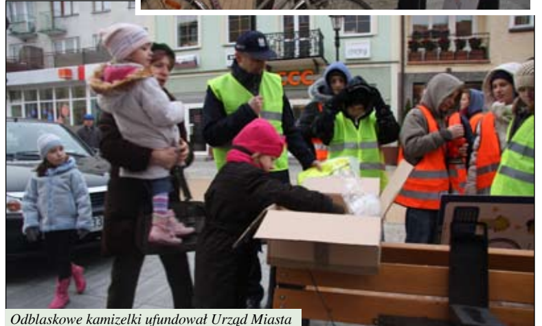
Odblaskowe kamizelki ufundował Urząd Miasta