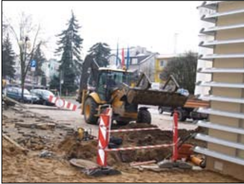
Trwa przebudowa parkingu przed wejściem do USC

Rozpoczęła się modernizacja Placu Jana Pawła II – drugiego (po deptaku) etapu rewitalizacji średniowiecznego traktu. Wykonawcą robót jest Firma Budowlano-Drogowa „PRASBET” z Grudziądza, która sprawdziła się już przy modernizacji ul. Warszawskiej. Planowane zakończenie prac – koniec października 2011 r. Koszt rewitalizacji Placu wyniesie ok. 8 mln zł.