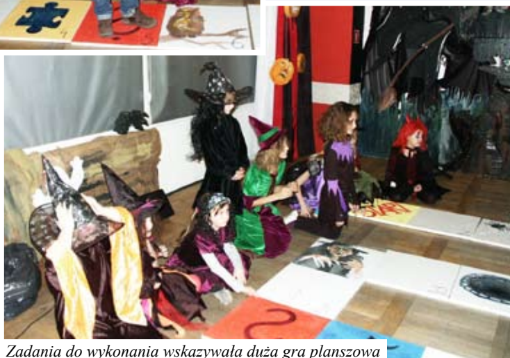
Zadania do wykonania wskazywała duża gra planszowa