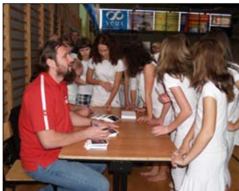
Mistrz olimpijski T. Majewski rozdaje autografy

Na uroczystym podsumowaniu pojawili się przedstawiciele władz wojewódzkich, powiatowych i miejskich. Najlepsze w klasyfikacji ogólnej szkoły podstawowe i gimnazja otrzymały nagrody. Na gali nie zabrakło wybitnych gości. Swoją obecnością uatrakcyjnili ją związani z Ciechanowem znani sportowcy: Piotr Małachowski (zdobywca srebrnych medali: Olimpijskiego z Pekinu, Mistrzostw Świata z Berlina i Mistrzostw Europy z Barcelony) oraz Tomasz Majewski (Mistrz Olimpijski z Pekinu i zdobywca srebrnych medali Mistrzostw Świata z Berlina i Mistrzostw Europy z Barcelony). Poja-