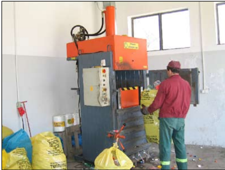
Składowisko w Woli Pawłowskiej już teraz dysponuje nowoczesnym sprzętem

odpadami komunalnymi dla gmin regionu ciechanowskiego". Projekt obejmuje m.in. budowę Regionalnego Za-