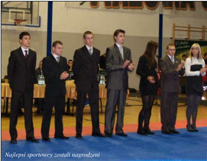
Najlepsi sportowcy zostali nagrodzeni