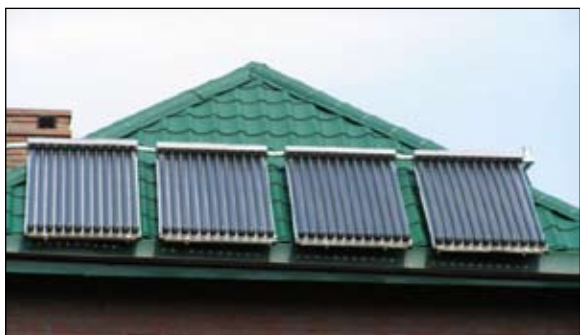
Przybywa zwolenników wykorzystywania energii słonecznej

Ksiądz mówiący o grzechach ekologicznych, wzywający wiernych aby nie zaśmiecili swojego sumienia – takie spoty kampanii edukacyjno-informacyjnej Ministerstwa Środowiska już od początku tego roku możemy usłyszeć w radio i zobaczyć w telewizji.