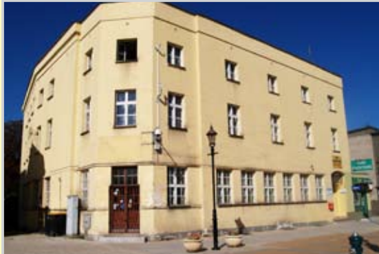
Budynek hotelu Polonia

Przypomnijmy: budynek przy ul. Warszawskiej 34, dawna siedziba hotelu Polonia, to jeden z domów w centrum, o których komunalizację stara się miasto. Nie jest to jednak pro-