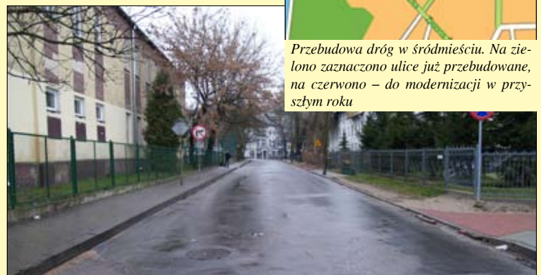
W przyszłym roku ul. Małgorzacka będzie miała nową nawierzchnię