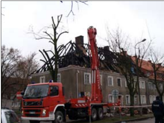
Po ugaszeniu miejsce zdarzenia badała policja w celu ustalenia przyczyn pożaru

W nocy z 23 na 24 listopada w jednym z mieszkań na poddaszu bloku przy ul. Świętochowskiego 2/6 wybuchł pożar. Ogień szybko rozprzestrzenił się na sąsiednie mieszkania i dach. Po ugaszeniu okazało się, że 15 mieszkań nie nadaje się do użytku. Pogorzelnicy otrzymali od miasta pomoc finansową i propozycję przeniesienia się na czas remontu do lokali zastępczych. – Nikt nie pozostanie bez dachu nad głową – uspokaja prezydent Waldemar Wardziński.