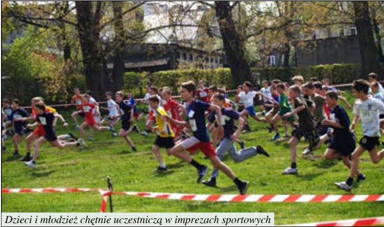
Dzieci i młodzież chętnie uczestniczą w imprezach sportowych

W 2010 roku Ciechanów był organizatorem dwóch największych imprez młodzieżowych w sporcie klubowym i szkolnym. Zawody w całości finansowane przez Ministerstwo Sportu przyniosły miastu korzyści promocyjne i materialne. Oprócz dobrodziejstw, jakie niesie ze sobą sportowa rywalizacja na organizacji dużych imprez sportowych dla dzieci Ciechanów zyskał nowoczesny sprzęt za 270 tys. zł. Mamy też szansę ubiegać się o ministerialne dofinansowanie modernizacji stadionu i tartanowej bieżni.