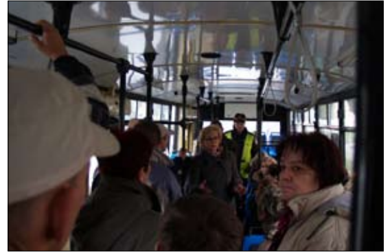
Pogorzelnicy mogli ogrzać się w autobusie podstawionym przez ZKM, do ich dyspozycji już w noc pożaru były pokoje w Hotelu Olimpijskim