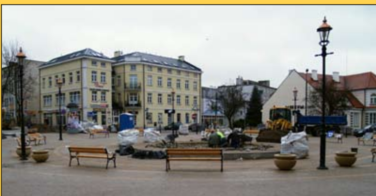
Do zakończenia przebudowy ul. Warszawskiej pozostało tylko ułożenie zegara słonecznego