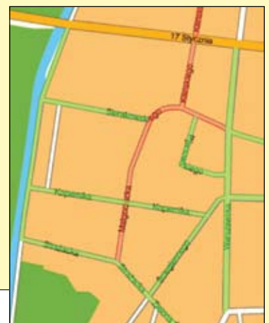
Przebudowa dróg w śródmieściu. Na zielono zaznaczono ulice już przebudowane, na czerwono – do modernizacji w przyszłym roku