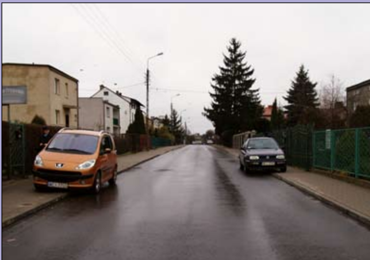
Nową nawierzchnię zyskała m.in. ul. Kicińskiego