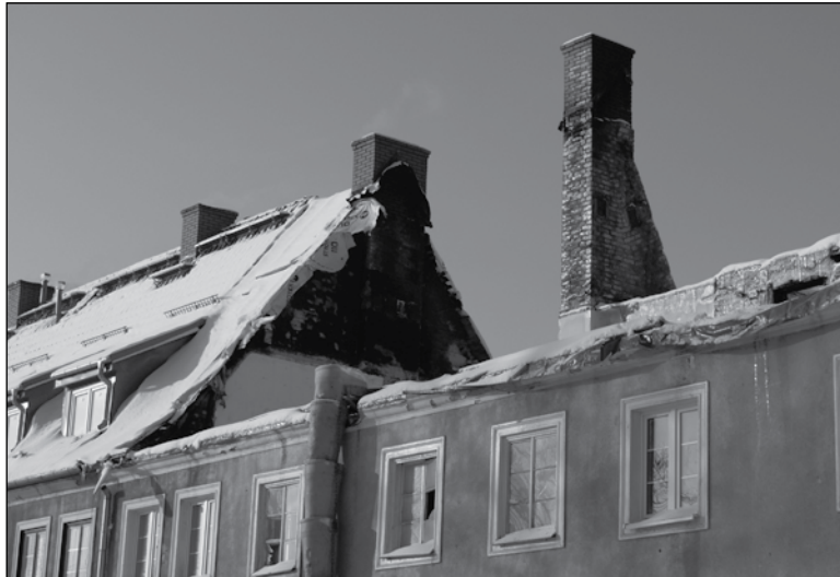
Zdemontowano nadpalone fragmenty dachu, rozpoczął się remont pięciu mieszkań

Po raz kolejny okazało się jak ofiarni i solidarni są ciechanowianie. Do Miejskiego Ośrodka Pomocy Społecznej wciąż napływają dary. MOPS, jako instytucja specjalizująca się w udzielaniu pomocy posiada dokładne informacje o najpilniejszych potrzebach pogorzelników i pośredniczy w przekazywaniu darów. Przy-