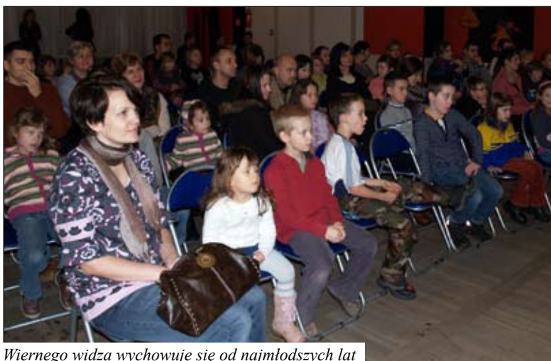
Wiernego widza wychowuje się od najmłodszych lat