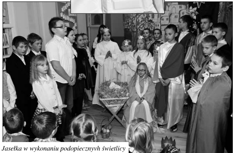
Jasełka w wykonaniu podopiecznych świetlicy