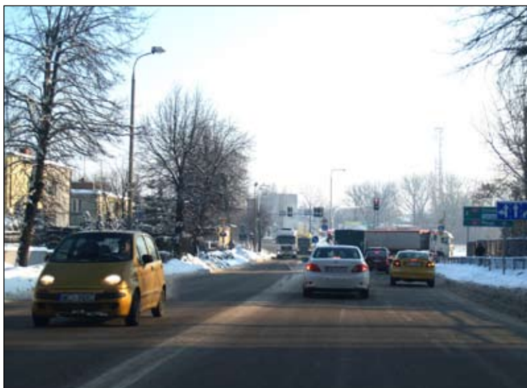
Ul. 17 Stycznia odśnieża Mazowiecki Zarząd Dróg Wojewódzkich

Zima obficie sypnęła białym puchem i zaczęło się odśnieżanie. Mieszkańcy dbają o swoje posesje i chodniki do nich przylegające, a czterej właściciele dróg dokładają starań, żeby ulice na terenie Ciechanowa były przejezdne. W naszym mieście częścią ulic opiekuje się gmina miejska, za swoje ulice odpowiadają zarządcy: powiatowy, wojewódzki i krajowy.