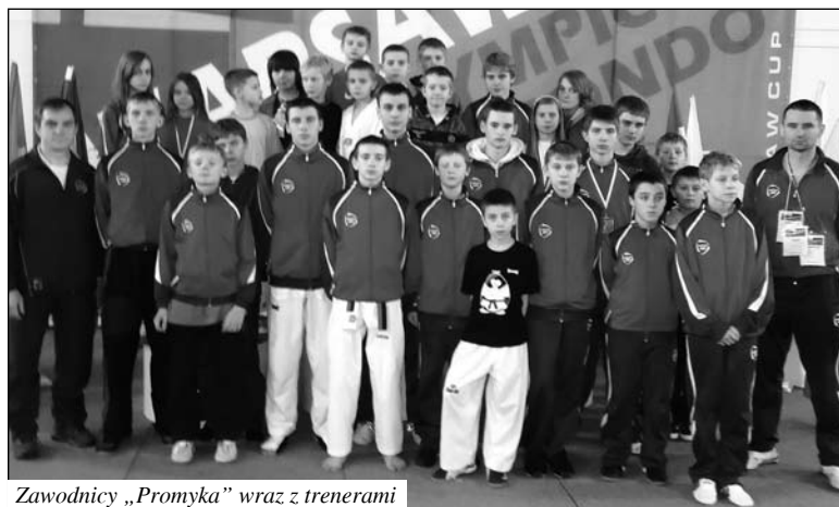
Zawodnicy „Promyka” wraz z trenerami