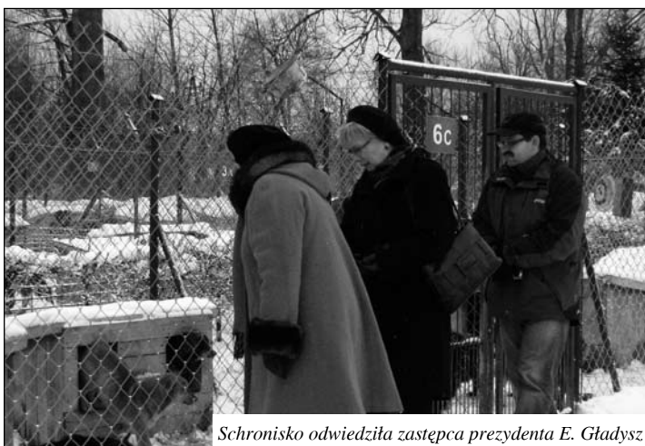
Schronisko odwiedziła zastępca prezydenta E. Gładysz

Blisko 5 ton jedzenia – to rekordowy bilans mikołajkowej zbiórki, przeprowadzonej po raz 14 w schronisku dla bezdomnych zwierząt w Pawłowie. Przekazane dary: 2560 kg suchej karmy, 980 kg makaronu, 870 kg kaszy i ryżu, 540 kg puszek uzupełnią pożywienie zwierząt. Przydadzą się też sprezentowane koce i miski.