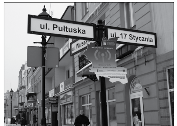
W centrum miasta działa strefa bezpłatnego internetu