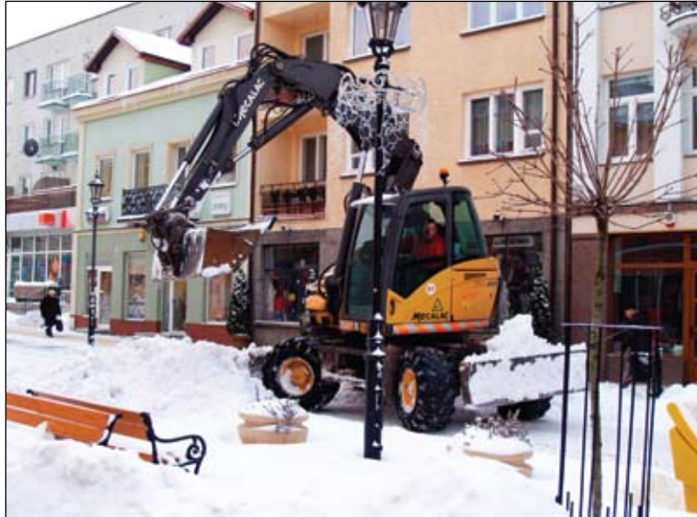
Usuwanie śniegu z deptaku

Po latach łagodnych zim mamy do czynienia z niskimi temperaturami i prawdziwymi śnieżycami. To duże wyzwanie dla służb komunalnych i mieszkańców, którym trudno nadać z usuwaniem śniegu. To również ogromny koszt dla miejskiego budżetu. W poprzednich latach w listopadzie i grudniu miasto wydawało na odśnieżanie około 60 tys. zł, do końca tego roku koszty zimowego utrzymania ulic wyniosą czterokrotnie więcej – ponad 240 tys. zł.