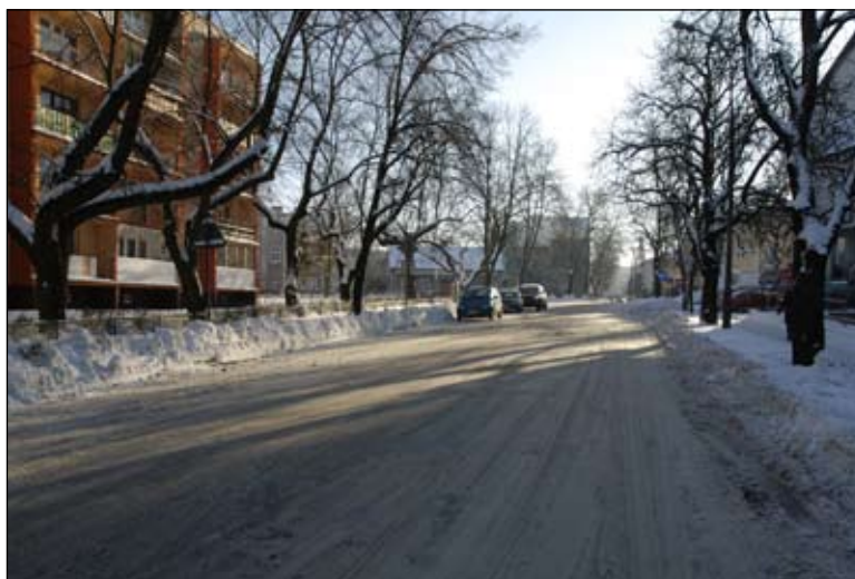
Ulica może być czarna pod warunkiem zastosowania większej ilości chemikaliów, ale ucierpiatoby na tym środowisko, głównie drzewa