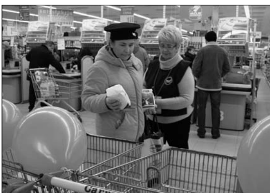
W akcję zaangażowali się mieszkańcy...