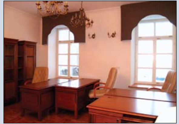
Znacznie poprawią się warunki pracy i przyjmowania interesantów

i meblowanie budynku odbywało się pod czujnym okiem przedstawiciela wojewódzkiego konserwatora zabytków.