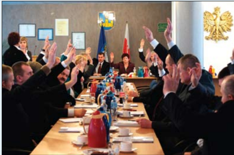
Taką zgodność chciałoby się widzieć podczas każdego głosowania

Pierwsza sesja nowej kadencji zdecydowała, ilu zastępców będzie miał przewodniczący i w ilu komisjach popracują radni. Wiemy też, kto pokieruje pracami Rady Miasta oraz jej komisji. Radni złożyli uroczyste ślubowanie.