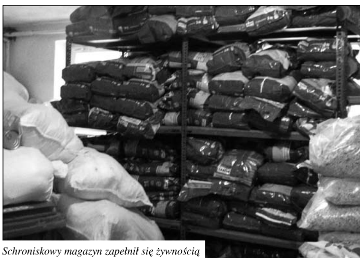
Schroniskowy magazyn zappełnił się żywnością