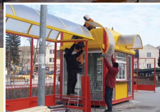
Montaż przystanku przy ul. Pułtuskiej