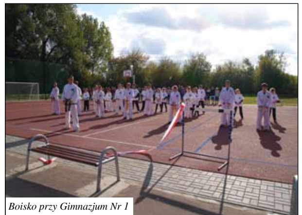
Boisko przy Gimnazjum Nr 1