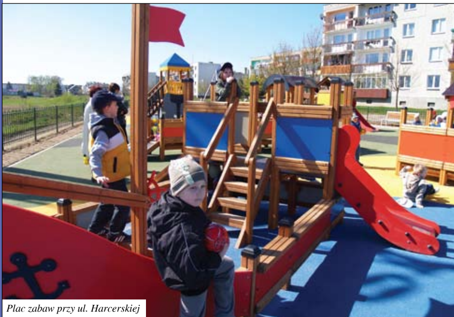
Plac zabaw przy ul. Harcerskiej