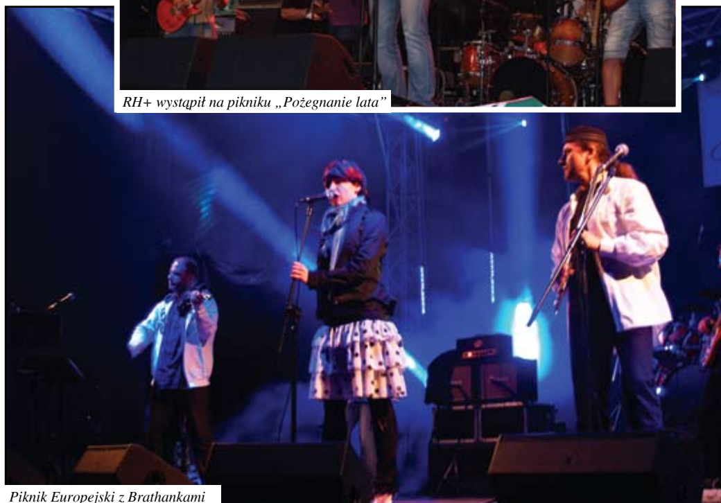
Piknik Europejski z Brathankami