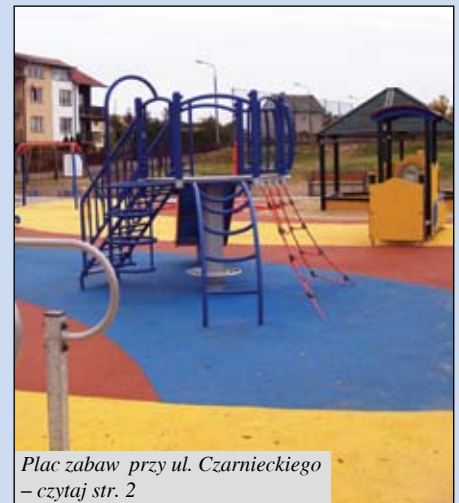
Plac zabaw przy ul. Czarnieckiego – czytaj str. 2