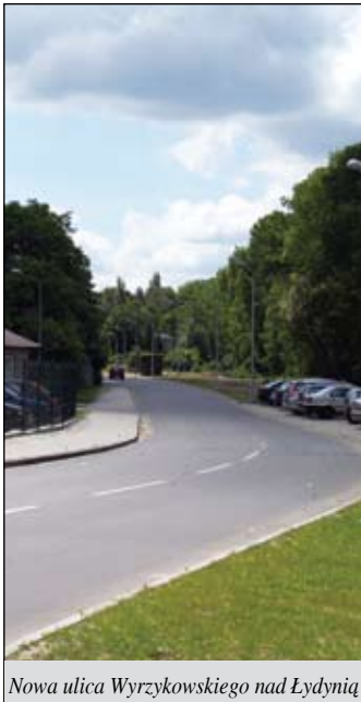
Nowa ulica Wyrzykowskiego nad Łydynią