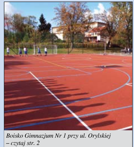
Boisko Gimnazjum Nr 1 przy ul. Orylskiej – czytaj str. 2