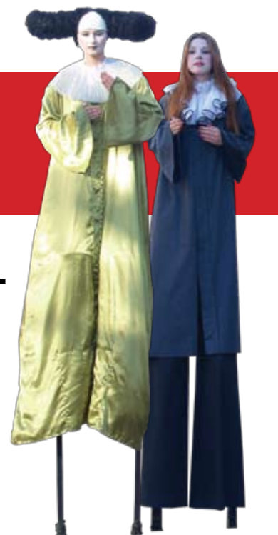
DIONIZJE: Teatr Feta