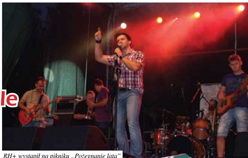
RH+ wystąpił na pikniku „Pożegnanie lata”