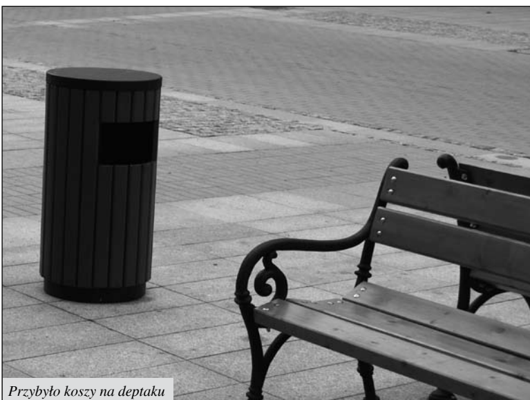
Przybyło koszy na deptaku

jedzenia. Przybyło także kontenerów na cmentarzu przy ul. Gostkowskiej. Miasto zakupiło kolejne 3 pojemniki spełniające wymogi sanitarne. Łącznie jest ich 9. Kosze ustawione zostały przy bramie głównej oraz przy bramach bocznych. Na terenie bulwarów ustawiono ok. 20 ławek zdemontowanych z terenu Placu Jana Pawła II, które wcześniej oczyszczono i pomalowano.