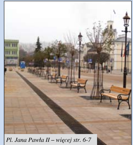
Pl. Jana Pawła II – więcej str. 6-7