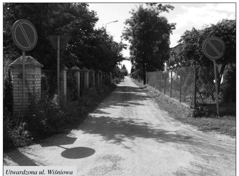
Utwardzona ul. Wiśniowa