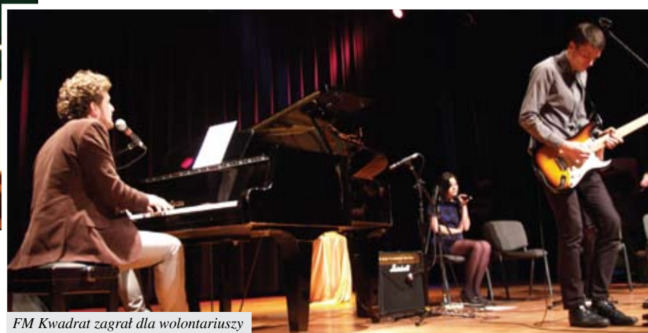
FM Kwadrat zagrał dla wolontariuszy