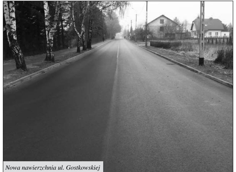
Nowa nawierzchnia ul. Gostkowskiej

Znaczną część budżetu pochłonęło ułożenie nowych nawierzchni bitumicznych na ulicach: Gostkowskiej (wraz z wymianą krawężnika na odcinku od ul. Parkowej do Komunalnej), Mościckiego (odc. ul. Księcia Konrada II w lewo), odc. Chabrowej, odc. Długiej (wraz ze skrzyżowaniem z ul. Sosnową), Broniewskiego (wraz z wymianą krawężnika po lewej stronie od ul. Wyspiańskiego). Ogółem ułożono 18,540 m 2 nowej nawierzchni bitumicznej.