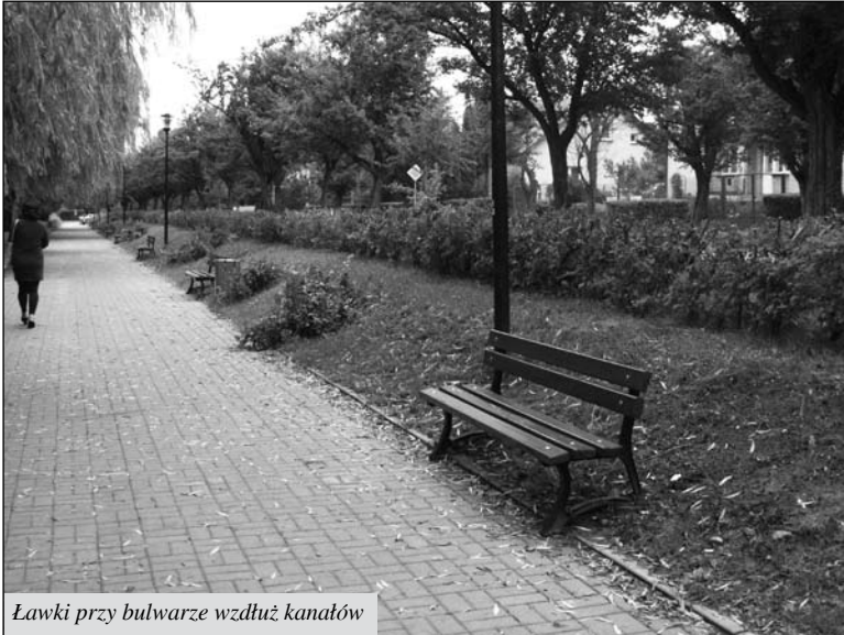
Lawki przy bulwarze wzdłuż kanałów