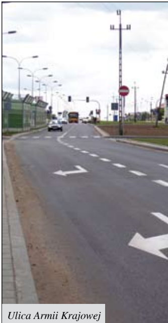
Ulica Armii Krajowej