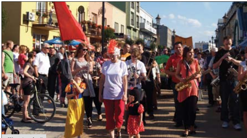
„Wrzuć na luz”