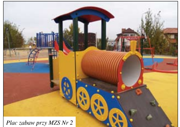
Plac zabaw przy MZS Nr 2