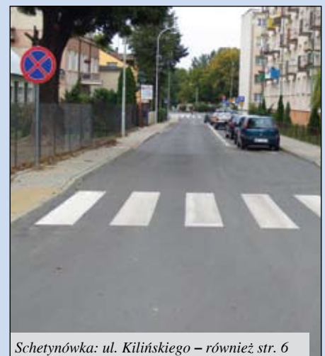
Schetynówka: ul. Kilińskiego – również str. 6

Pismo Samorządu Terytorialnego „Wspólnota” sporządziło ranking wykorzystania środków unijnych przez samorzady. Wzięto pod uwagę projekty, które dostały dofinansowanie z UE w perspektywie finansowej 2007-2013 – zarówno już zakończone, jak i będące w trakcie realizacji.