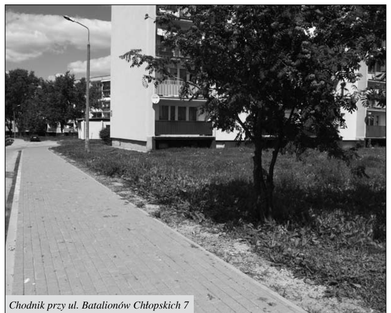
Chodnik przy ul. Batalionów Chłopskich 7

Miasto ustawiło dodatkowo dziesięć drewniano-metalowych koszy, które stanęły na ul. Warszawskiej. Kosze posiadają pokrywy, które uniemożliwiają ptakom i innym zwierzętom wyciąganie resztek