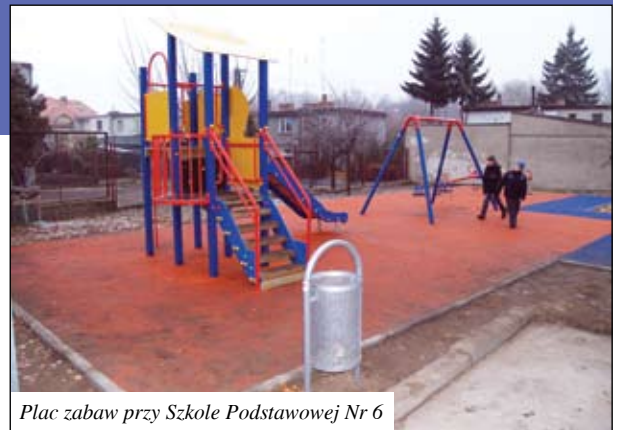
Plac zabaw przy Szkole Podstawowej Nr 6