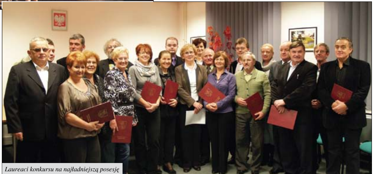
Laureaci konkursu na najładniejszą posesję

W 2011 roku Urząd Miasta przeznaczył przeszło 781 tys. zł na otwarte konkursy ofert, z których skorzystały kluby sportowe, organizacje pozarządowe oraz instytucje kultury. Z całej puli 530 tys. zł rozdysponowano na upowszechnianie kultury fizycznej i sportu, 130 tys. zł na kulturę, sztukę oraz ochronę dóbr kultury i tradycji, 50 tys. zł na ochronę i promocję zdrowia, ponad 48 tys. zł na oświatę, edukację i wychowanie oraz 40 tys. zł na pomoc społeczną. Dodatkowo w trybie małych grantów organizacje i kluby otrzymały przeszło 43 tys. zł.