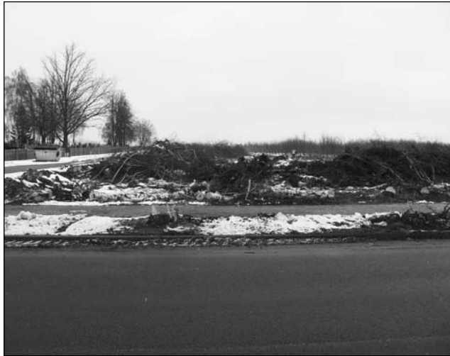
Sad Państwa Porowskich to przykład zagospodarowanej nieruchomości, za którą miasto zapłaci odszkodowanie w drodze specustawy

Grunty pod wewnętrzną pętlę komunikacyjną miasto najpierw kupowało, potem przejmowało w drodze specustawy drogowej, na mocy której dotychczasowi właściciele terenów są wywłaszczani na rzecz gminy z gruntów. Wysokość odszkodowania ustala starosta. Wszczyła postępowanie w trybie