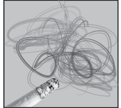
Coraz młodsze dzieci sięgają po papierosy Pałą koniety w ciąży i matki Każdego dnia 4 mln ludzi wdycha biernie trujący dym