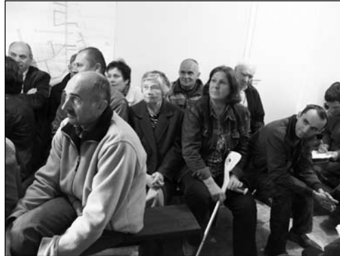
Osiedlowa salka okazała się za ciasna na takie spotkania