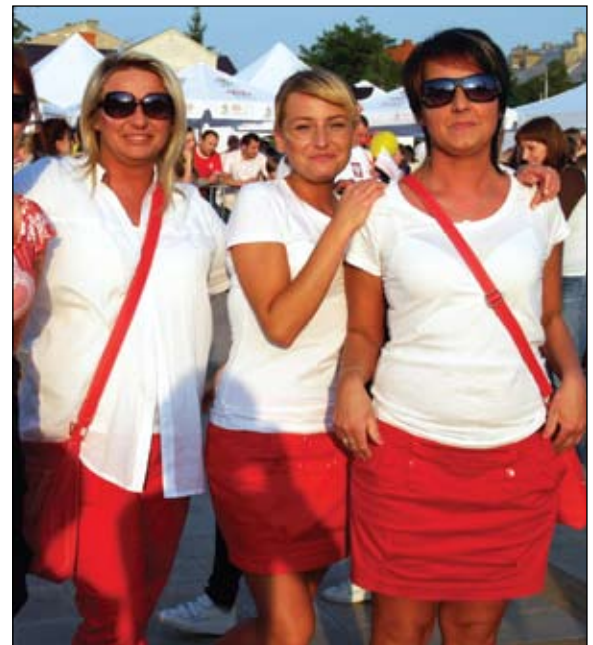
Ciechanowianki w narodowych barwach – piękne i pomysłowe