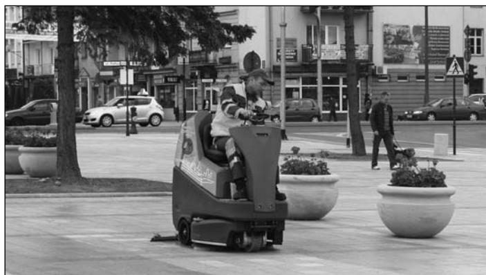
Szorowanie posadzki na Pl. Jana Pawła II