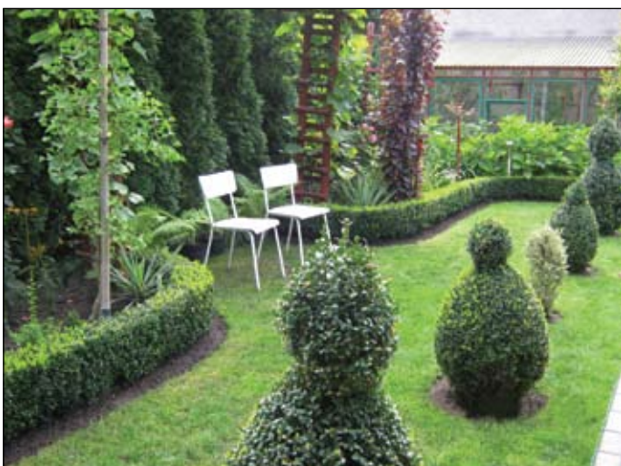
1 miejsce w ubiegłorocznym konkursie w kategorii budynki jednorodzinne (ul. Parkowa 47)