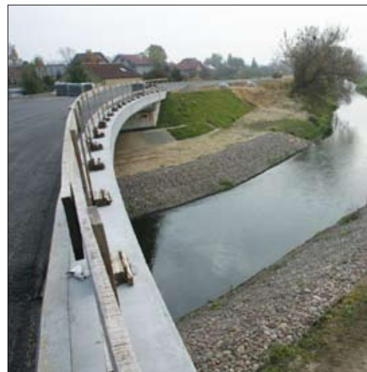
Most na Bielinie

Za rok budowana pętla miejska skomunikuje ze sobą wszystkie dzielnice miasta. Dzięki niej ruch ciężkich samochodów wyprowadzony zostanie poza centrum. Nowa droga to także dostęp do nowych terenów pod inwestycje i budownictwo. Koszt tej piętnastokilometrowej drogi z chodnikami i ścieżkami rowerowymi to blisko 196 mln złotych.