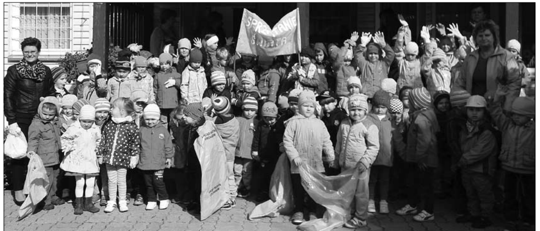
Co roku przedszkolaki z „Piątki” aktywnie biorą udział w akcji sprzątania świata

„Odkrywamy czystą Polskę” – pod takim hasłem w dniach 20-22 września odbyła się tegoroczna edycja sprzątania świata. Tradycyjnie wzięli w niej udział uczniowie ciechanowskich szkół oraz przedszkolaki. Uczestniczenie w dorocznym porządkowaniu otoczenia to cenna lekcja ekologii. – Przedszkolaki zaopatrzone w rękawiczki oraz worki wyruszyły, aby sprzątać teren wokół przedszkola. Każdy starał się jak najdokładniej wykonać zadanie. Bardzo cieszymy się, że choć odrobinę pomogliśmy. Mamy nadzieję, że widząc ile wysiłku trzeba włożyć w sprzątanie po sobie, żadne z nich nie wyrzuci papierka po cukierku czy chipsach na trawnik