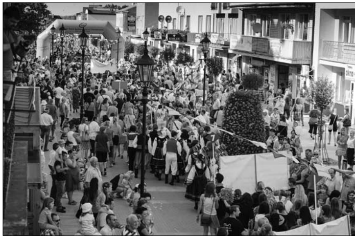
Deptak został zaakceptowany przez mieszkańców