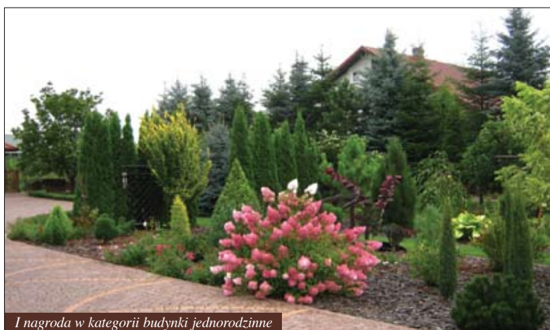
I nagroda w kategorii budynki jednorodzinne