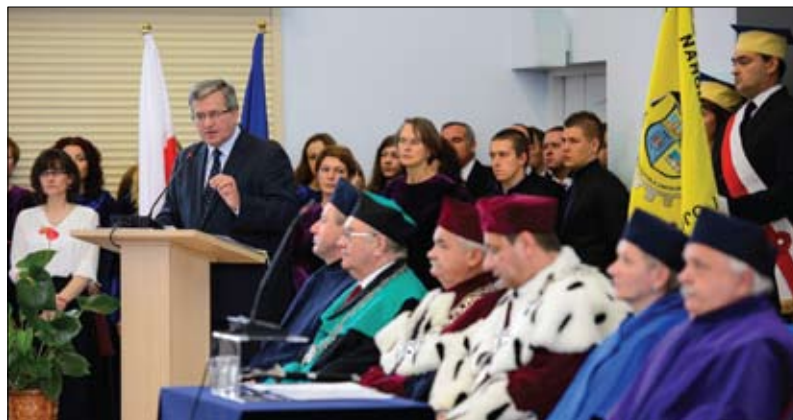
W obecności władz oraz studentów uczelni prezydent RP wygłosił przemówienie