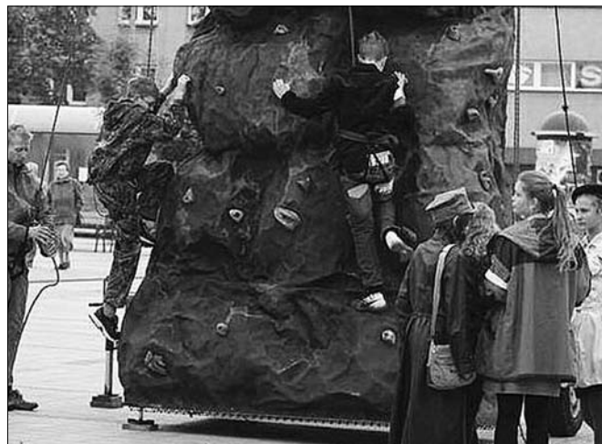
Wspinaczka po pionowej ścianie nie była łatwa