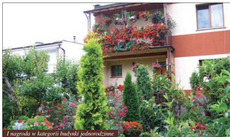
I nagroda w kategorii budynki jednorodzinne