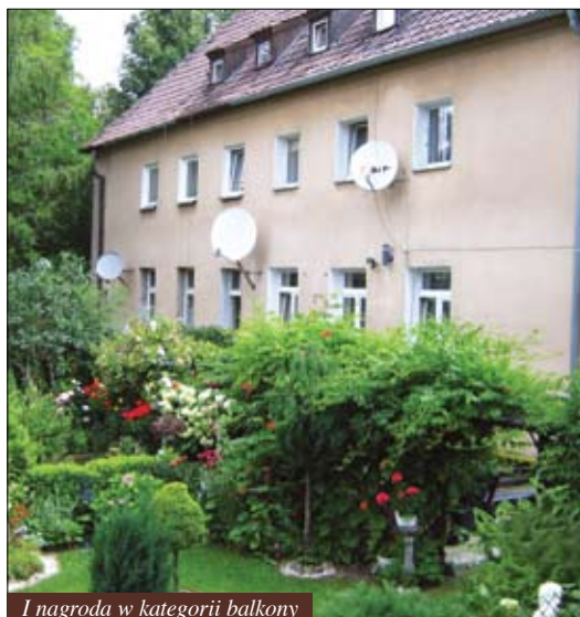
I nagroda w kategorii balkony