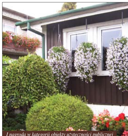
I nagroda w kategorii obiekty użyteczności publicznej