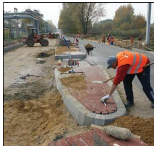
Budowa skrzyżowania pętli z ul. Niechodzką