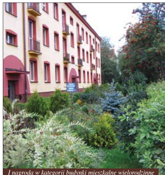
I nagroda w kategorii budynki mieszkalne wielorodzinne