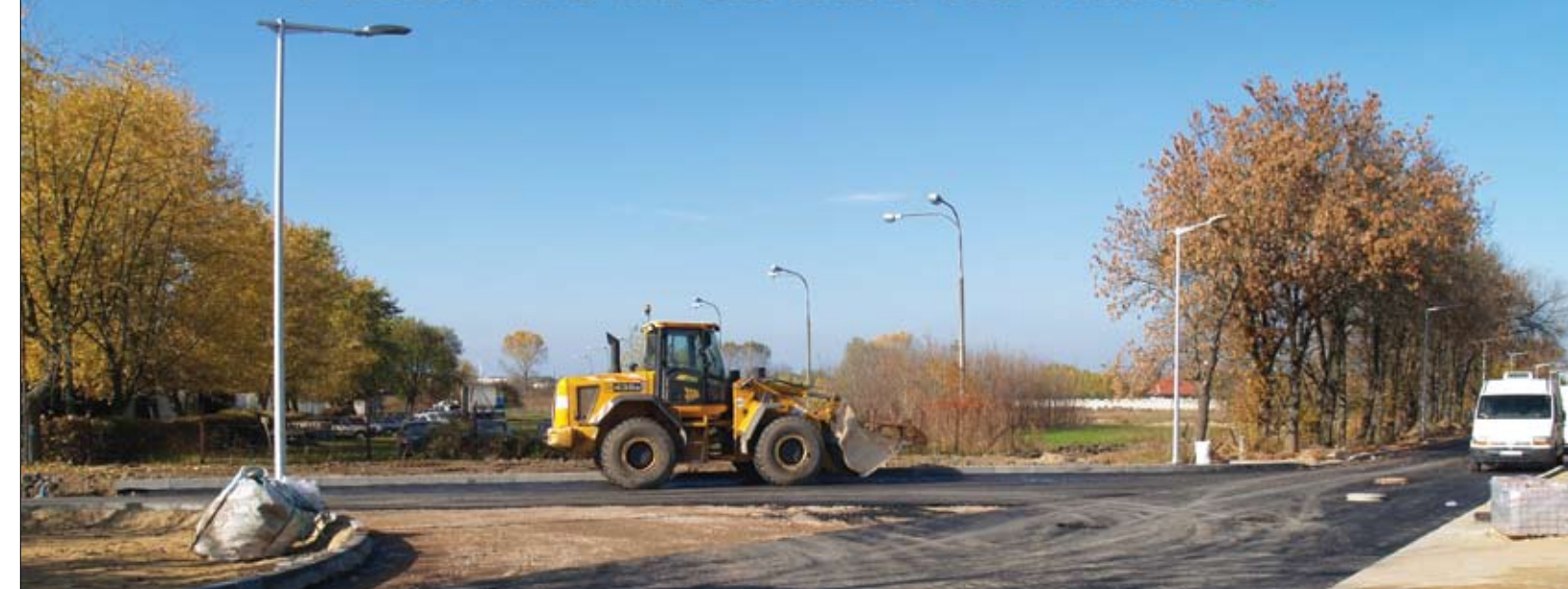
Powstaje skrzyżowanie ul. Krubińskiej z Ceramiczną

– Przebudowane zostały kolidujące urządzenia i sieci telekomunikacyjne, gazowe i elektroenergetyczne. Ulica Ceramiczna na odcinku ok. 200 m przed i za skrzyżowaniem oraz jej odnoga zostały przygotowane do ułożenia asfaltu. Trwają też prace na kolejnym odcinku ul. Krubińskiej: wykonywana