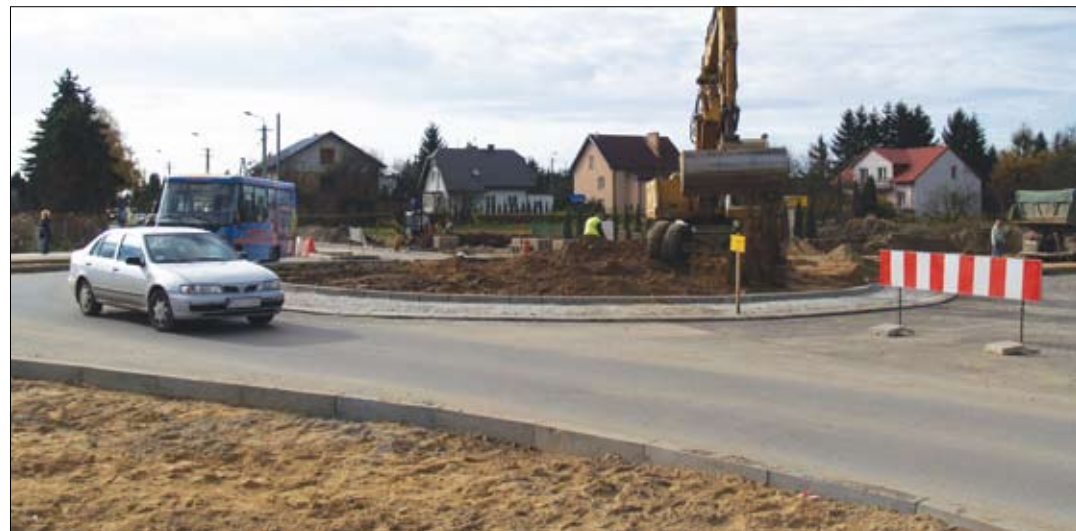
Ulica Gostkowska – nowe rondo. Prace dobiegają końca

W ostatnim czasie drogowcy ułożyli 3,5 tys. ton asfaltu. Dobiać końca budowa dwóch mostów: północnego (pomiędzy ul. Gostkowską i Wojska Polskiego) i południowego (na Bielinie). Umacniane są brzozy oraz dno rzeki Lydyny. Wykonawca, prawdopodobnie jako pierwszy na północnym Mazowszu, zastosował tu technologię tzw. materacy gabionowych. To specjalne metalowe kosze wypełnione kamieniami. Najbardziej zaawansowane prace trwają