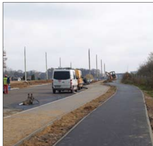
Pomiędzy ul. Gostkowską a Wojska Polskiego jest już jezdnia, ścieżki rowerowe i chodniki. Trwa budowa oświetlenia