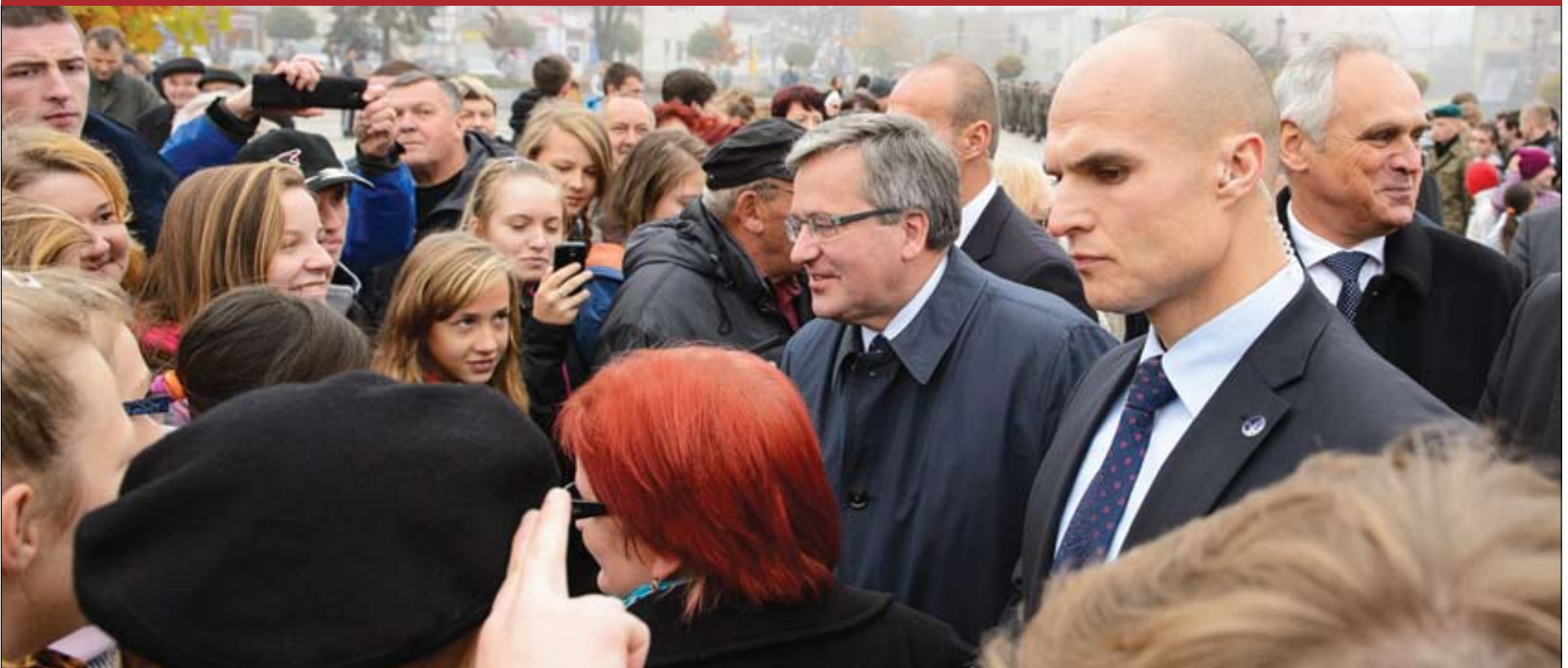
Prezydent RP Bronisław Komorowski witał się z mieszkańcami Ciechanowa na Placu Jana Pawła II

17 października w Ciechanowie gościł Prezydent Rzeczypospolitej Polskiej Bronisław Komorowski. Prezydent RP przywitał się z mieszkańcami, czekającymi na Placu Jana Pawła II. W ratuszu spotkał się