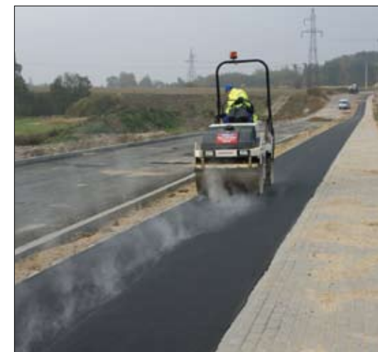
Wylewanie ścieżek rowerowych na Bielinie