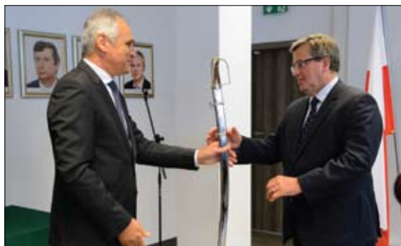
Prezydent Ciechanowa W. Wardziński podarował prezydentowi RP B. Komorowskiemu replikę polskiej szabli

się Ciechanów na przestrzeni ostatnich lat. – Warto czasem wrócić do przeszłości, uzmysłowić sobie, jak długą drogę przeszliśmy i jak wiele osiągnęliśmy. To uzmysławia nam, ile można osiągnąć, kiedy działamy wspólnie, w zgodzie – powiedział prezydent Komorowski, komplementując rozwój Ciechanowa. Prezydent Wardziński w imieniu zebranych podkre-