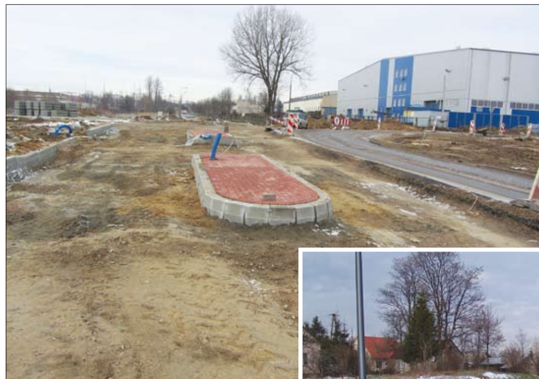
Budowa skrzyżowania łączącego ul. Tysiąclecia z Mleczarską

Zimowa aura nie zakłóca pracy przy budowie miejskiej arterii. Zakończyła się przebudowa sieci wodociągowej w obrębie skrzyżowań pętli z ul. Wojska Polskiego i Pułtuską. Na szczęście ruch odbywał się tam bez większych zakłóceń. Usunięta została kolizja z kablami energetycznymi na fragmencie ulicy Mleczarskiej – od Tysiąclecia do Mazowieckiej. – Warstwy ścieralne nawierzchni asfaltowych powstaną w 2015 roku. Wtedy też czekają mieszkańców największe utrudnienia w ruchu spowodowane pracami na wszystkich skrzyżowaniach nowej drogi. Łącznie powstaną tam 26 skrzyżowań –