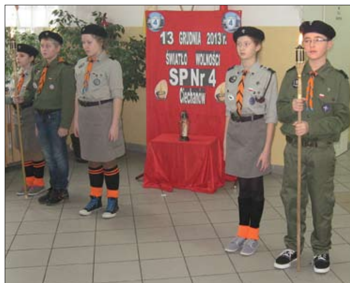
... i Szkole Podstawowej Nr 4