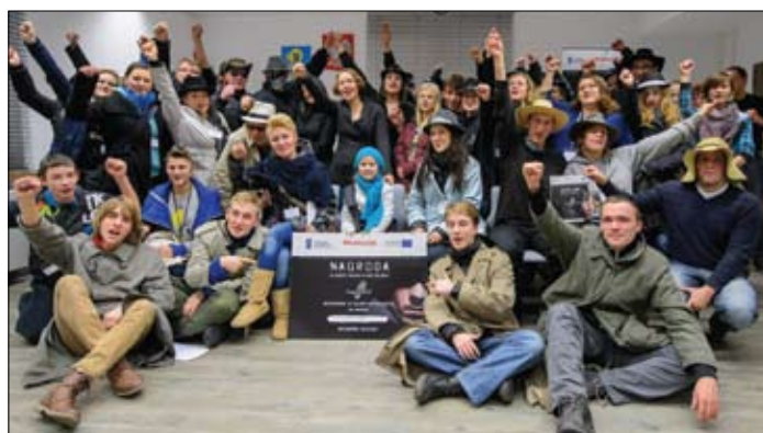
Uczestnicy gry w ciechanowskim ratuszu

30 listopada rozegrana została gra „Tropy Europy II – na tropie przygody!”. Ciechanów stał się miejscem rywalizacji tajnych agentów nie tylko z naszego miasta, ale także z Warszawy, Siedlec, Płocka i Płońska. W trakcie 4 godzin gry blisko 50 wysłanników centrali europejskich wywiadów o tajemniczych kryptonimach zmagало się z ciekawymi wyzwaniami.