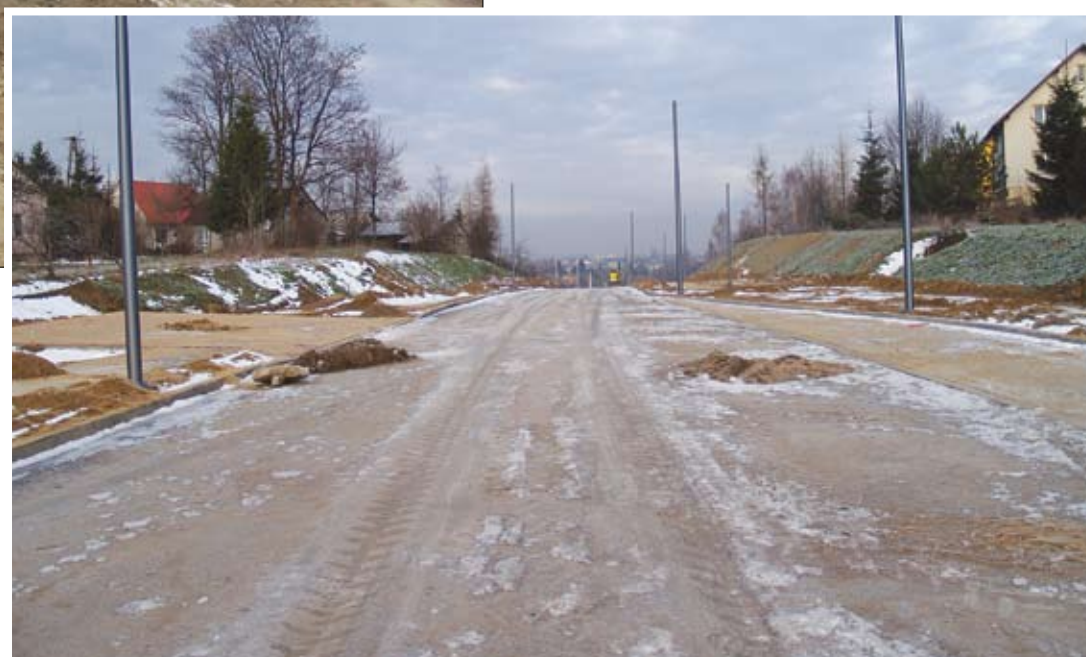
Nowa jezdnia pomiędzy ul. Monte Cassino i Klonowskiego