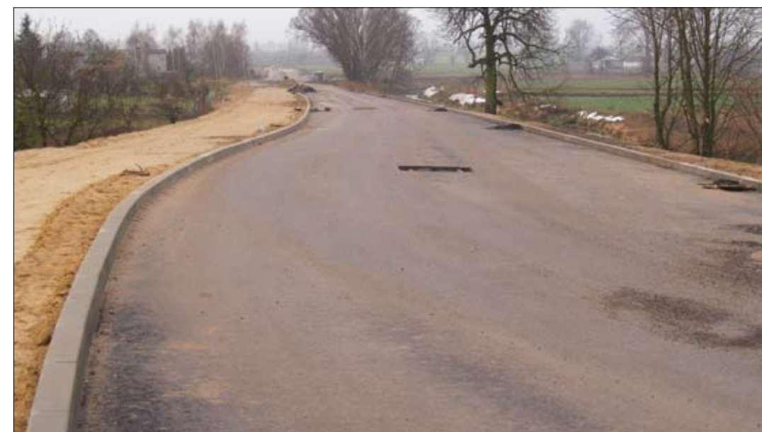
Nowa droga na Bielinie łącząca most z ul. Kasprzaka