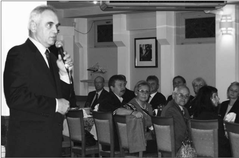
Prezydent W. Wardziński złożył życzenia przedstawicielom NGO

12 grudnia władze miasta zaprosiły przedstawicieli organizacji pozarządowych do hotelu „Baron” na spotkanie opłatkowe. Prezydent złożył im życzenia, podkreślając, jak ważne jest to, co robią dla mieszkańców.