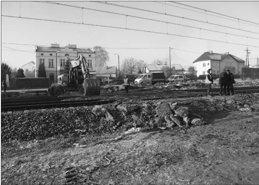
Prace porządkowe na terenie byłego przejazdu w ul. Fabrycznej

Do tej pory mieszkańcy Śmiecin, Śmiecin i Szczurzynka na drugą stronę torów dostawali się przez wiadukt i 4 przejazdy: Spółdzielcza – Śmiecińska, Mleczarska, Gąsecka i właśnie Fabryczna.