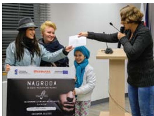
„Cichociemni” – zwycięska drużyna odbiera główną nagrodę

Nagrodą główną był lot balonem nad Mazowszem dla 4 osób. Misja nie była łatwa – należało pozyskać jak najwięcej cennych informacji i sprawdzić się w emocjonujących zadaniach godnych superagentów. Miejscem startu był ratusz. Wyzwania czekały w rozsianych po całym mieście obiektach, które