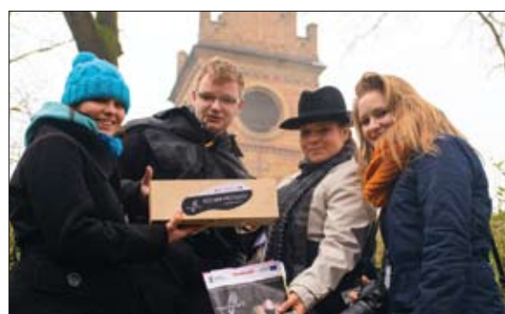
„Aniołki Kowalskiego” z nagrodą specjalną ukrytą pod dzwonicą

grupy „Geronimy”. – W Ciechanowie jesteśmy po raz pierwszy. Przy okazji gry udało nam się trochę poznać. Wieża ciśnieni istotnie robi duże wrażenie. Naszym zdaniem jest bardzo ładna. Dzięki różnorodności zadań każdy z nas mógł się wykazać. Najlepiej poszła nam dyscyplina w Kombatancie, gdzie podczas „wiosnowania” zadawano nam pytania sprawdzające naszą wiedzę o Ciechanowie.