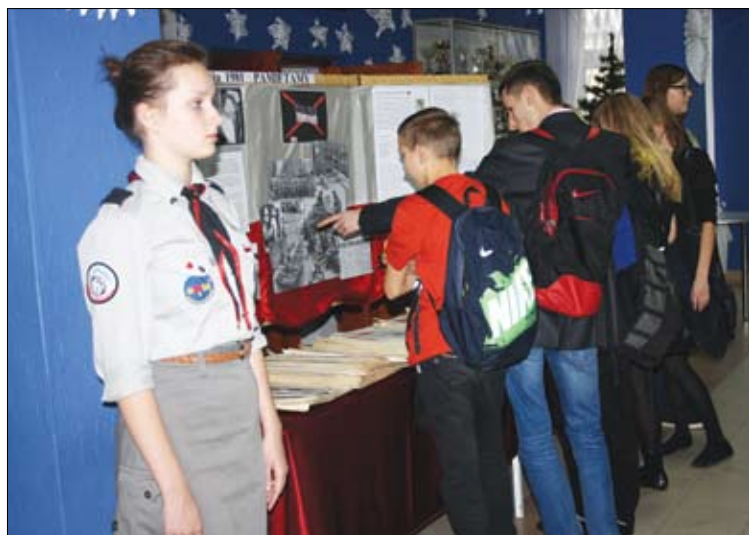
W rocznicę stanu wojennego warte zaciągnięto m.in. w Gimnazjum Nr 3...

13 grudnia o 19.30 w oknach zapłonęły świece. W ten sposób mieszkańcy uczcili pamięć ofiar stanu wojennego. Można było również kliknąć na miniaturkę świece na stronie internetowej IPN. W roku 2012 wirtualną świecę zapaliło ponad 11 tys. osób. Akcja zainicjowana przez IPN, nawiązywała do gestu solidarności, jaki wobec represjonowanych Polaków wykonały rzesze mieszkańców państw zachodnich w 1981 r. Świeca zapłonęła wtedy również w Pałacu Apostolskim i Białym Domu. W obchody 32. rocznicy ogłoszenia stanu wojenne-