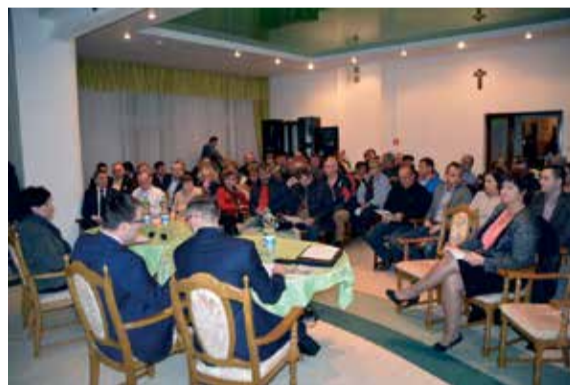
– osiedle „Słoneczne”