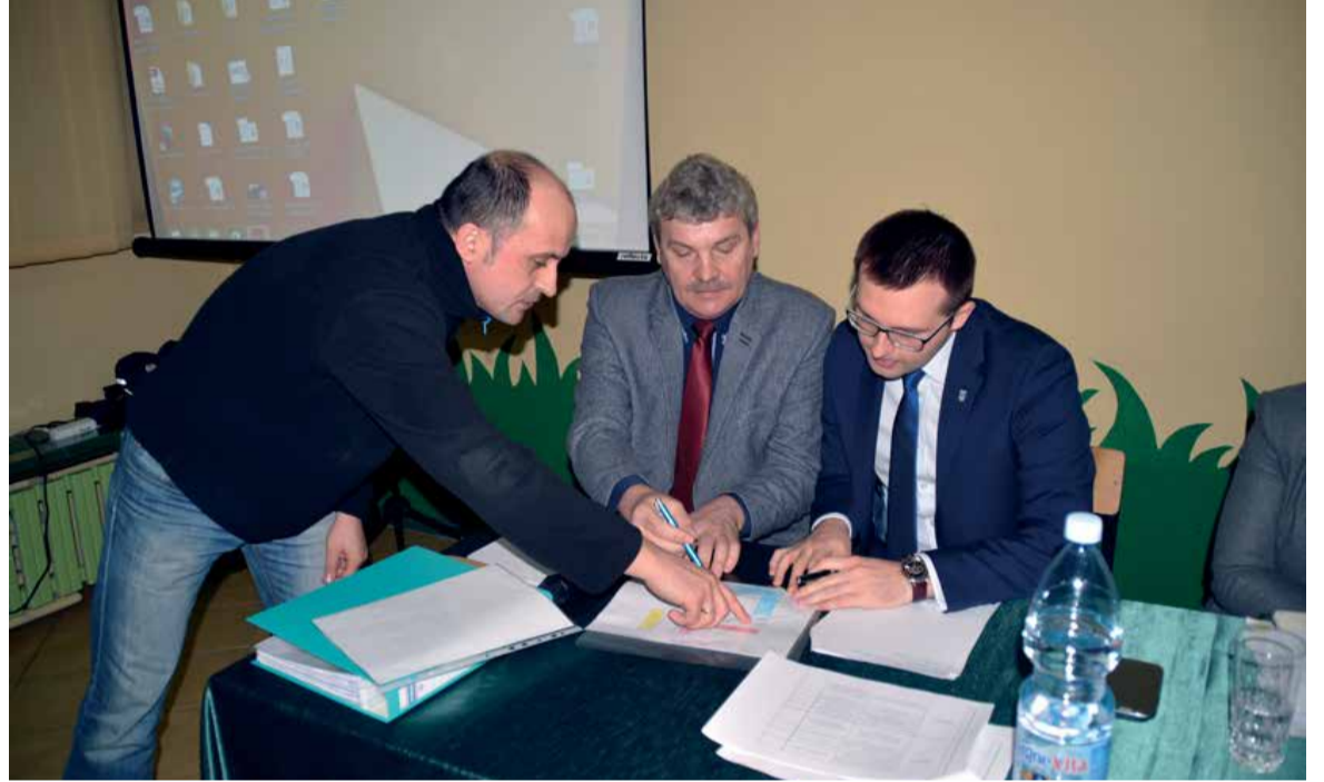
Spotkania osiedlowe – osiedle „Aleksandrówka”

temu takie spotkania odbywały się przy okazji wyborów do zarządów osiedli. Prezydent zdecydował, że będzie spotykał się z mieszkańcami nie tylko przy tej okazji, ale co roku. P.H.