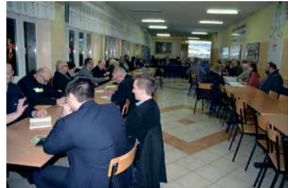
– osiedle „Kwiatowe”