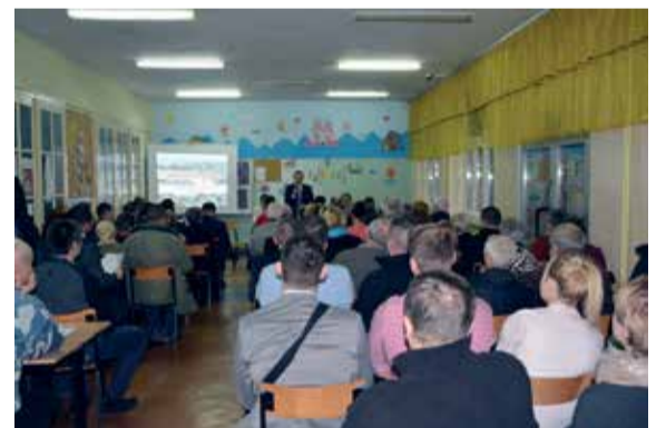
– osiedle „Przemysłowe”