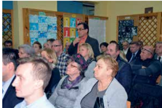
– osiedle „Aleksandrówka II”