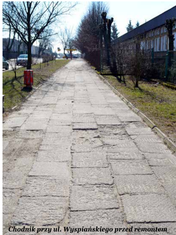
Chodnik przy ul. Wyspiańskiego przed remontem