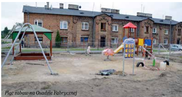
Plac zabaw na Osadzie Fabrycznej