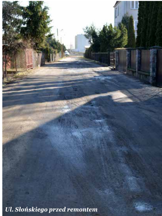
Ul. Słońskiego przed remontem