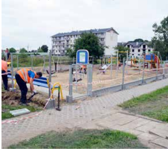
Plac zabaw przy ul. Powstańców Wielkopolskich