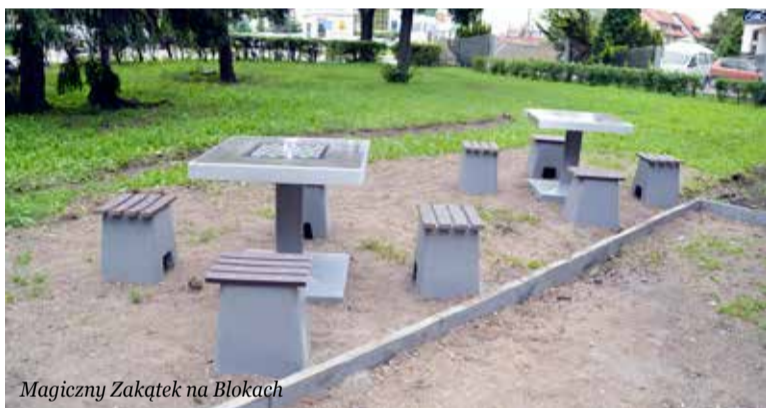
Magiczny Zakątek na Blokach