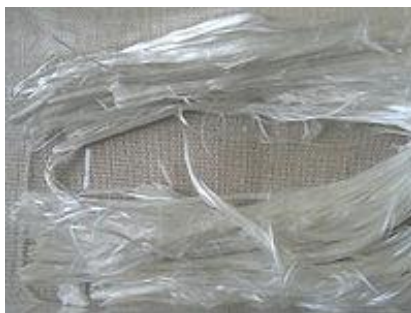
Włókna azbestu 1

Azbest był wykorzystywany jako bardzo dobry surowiec do czasu udowodnienia jego szkodliwego oddziaływania na zdrowie ludzi, tj. do połowy lat 80-tych ubiegłego stulecia. Dowiedziono wówczas, że włókna azbestu (o grubości mniejszej niż 3,0 i długości powyżej 5,0 mikrometrów) przedostające się do organizmu człowieka z wdychanym powietrzem są rakotwórcze.